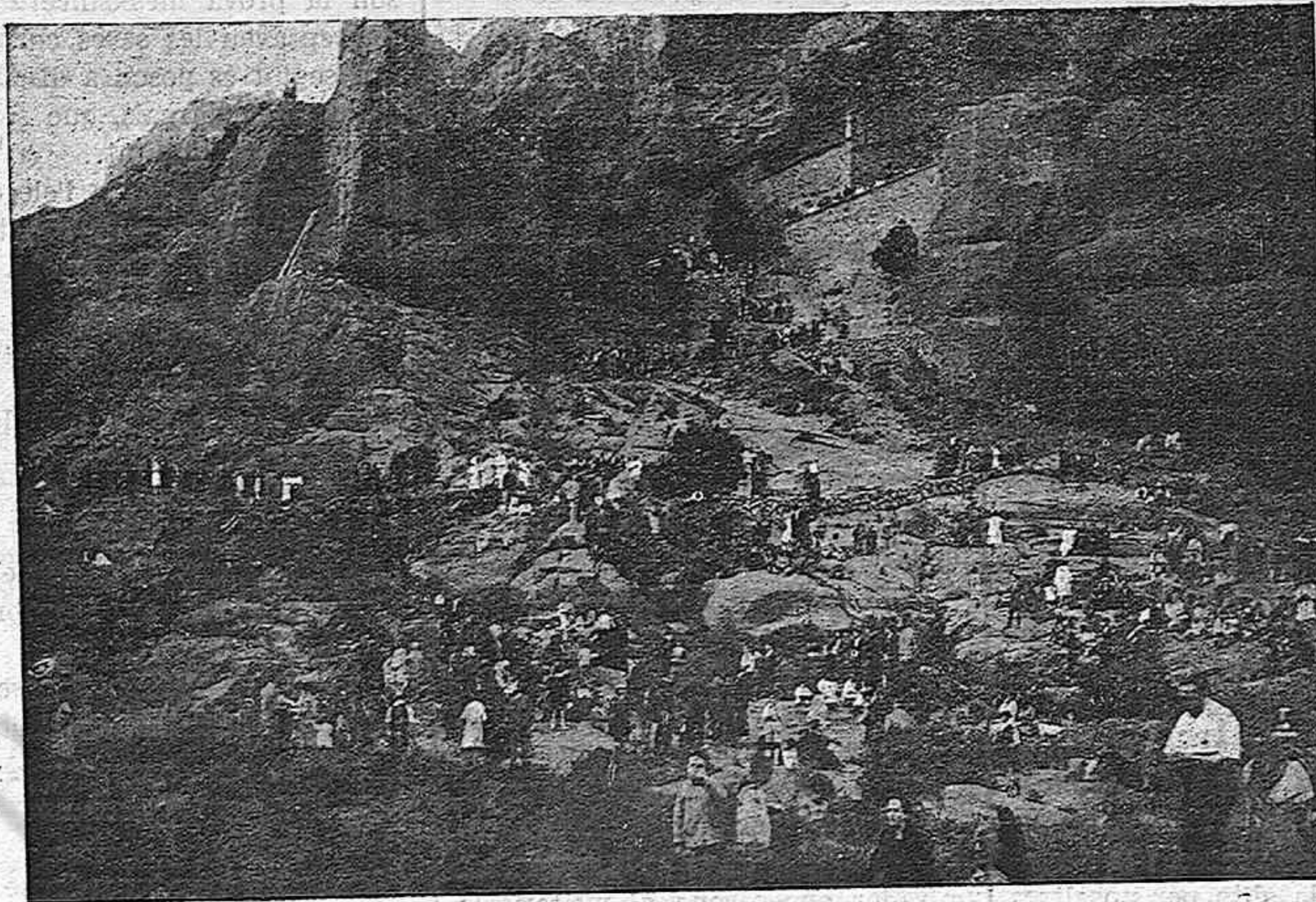
Un dia de festa a l'ermita de Sant Gregori