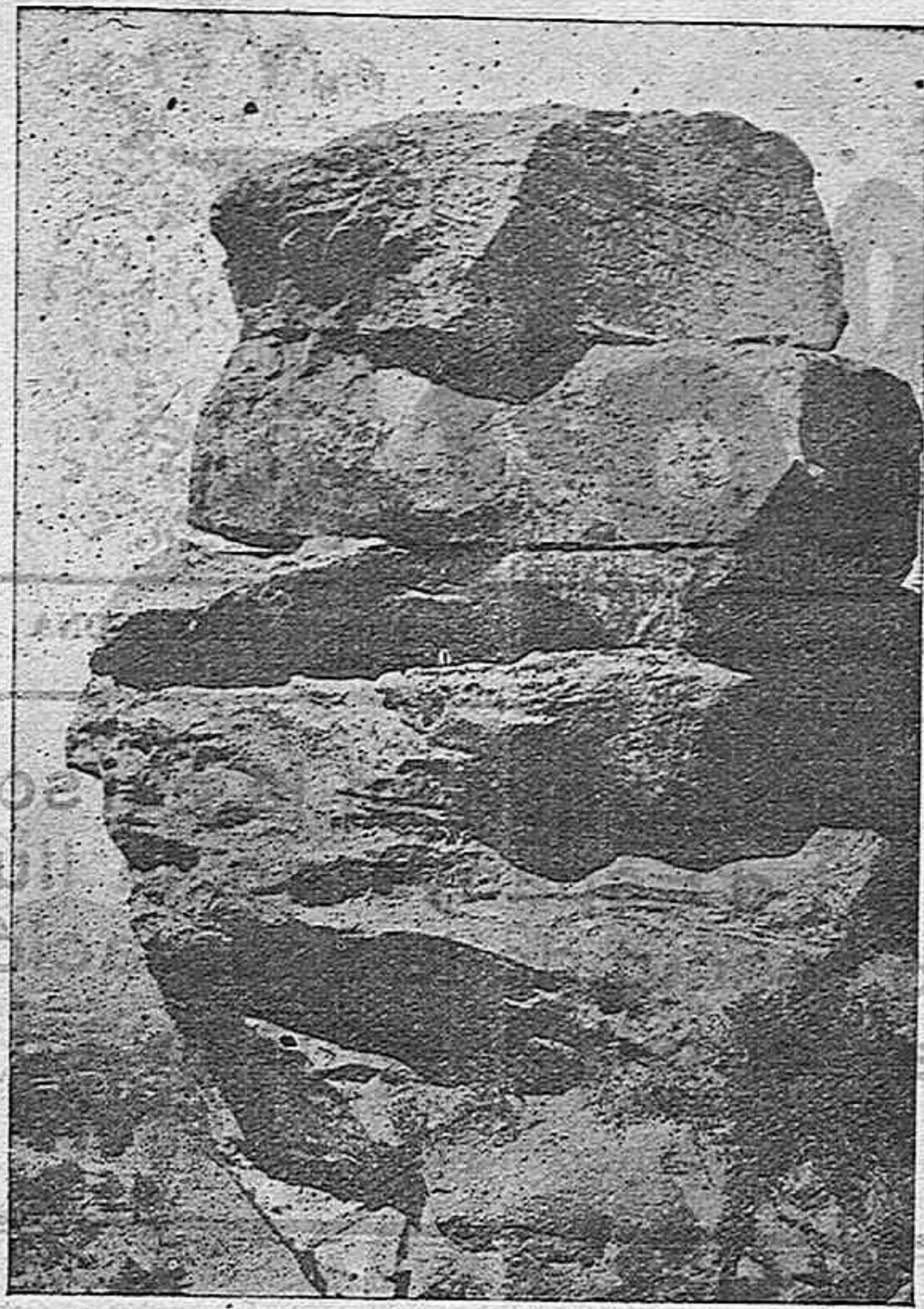
Ermита de Sant Gregori — Cap del Gegant