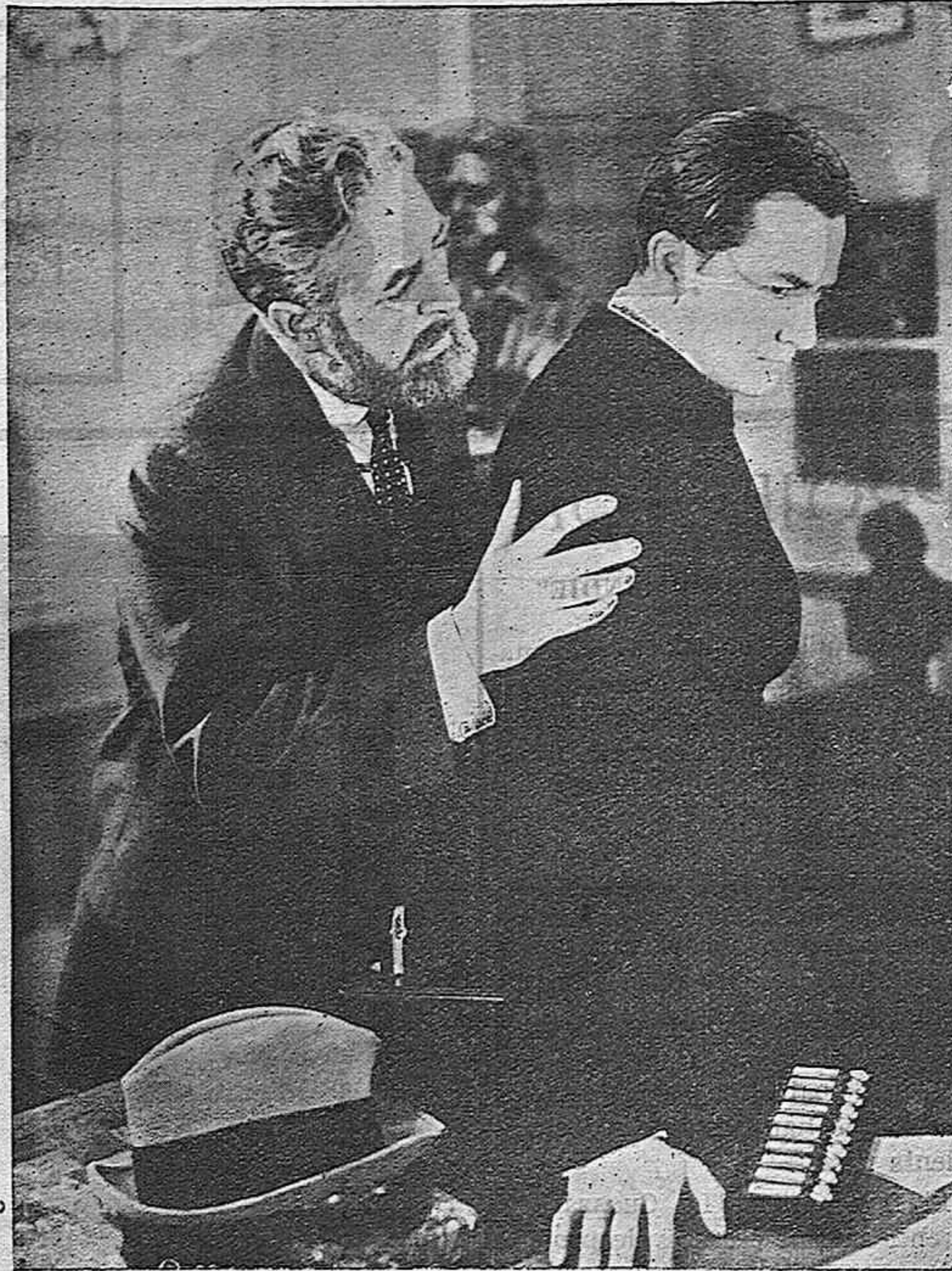
Uno de los momentos del film Columbia "Lo que los dioses destruyen" que distribuye la marca CIFESA

La poesía y dulzura de la Alemania sencilla y aburguesada de sus pueblos bellos y pintorescos, de las proximidades del famoso lago de Constanza, luce en el film "La santa y el loco" con una abundancia que atrae y subyuga.