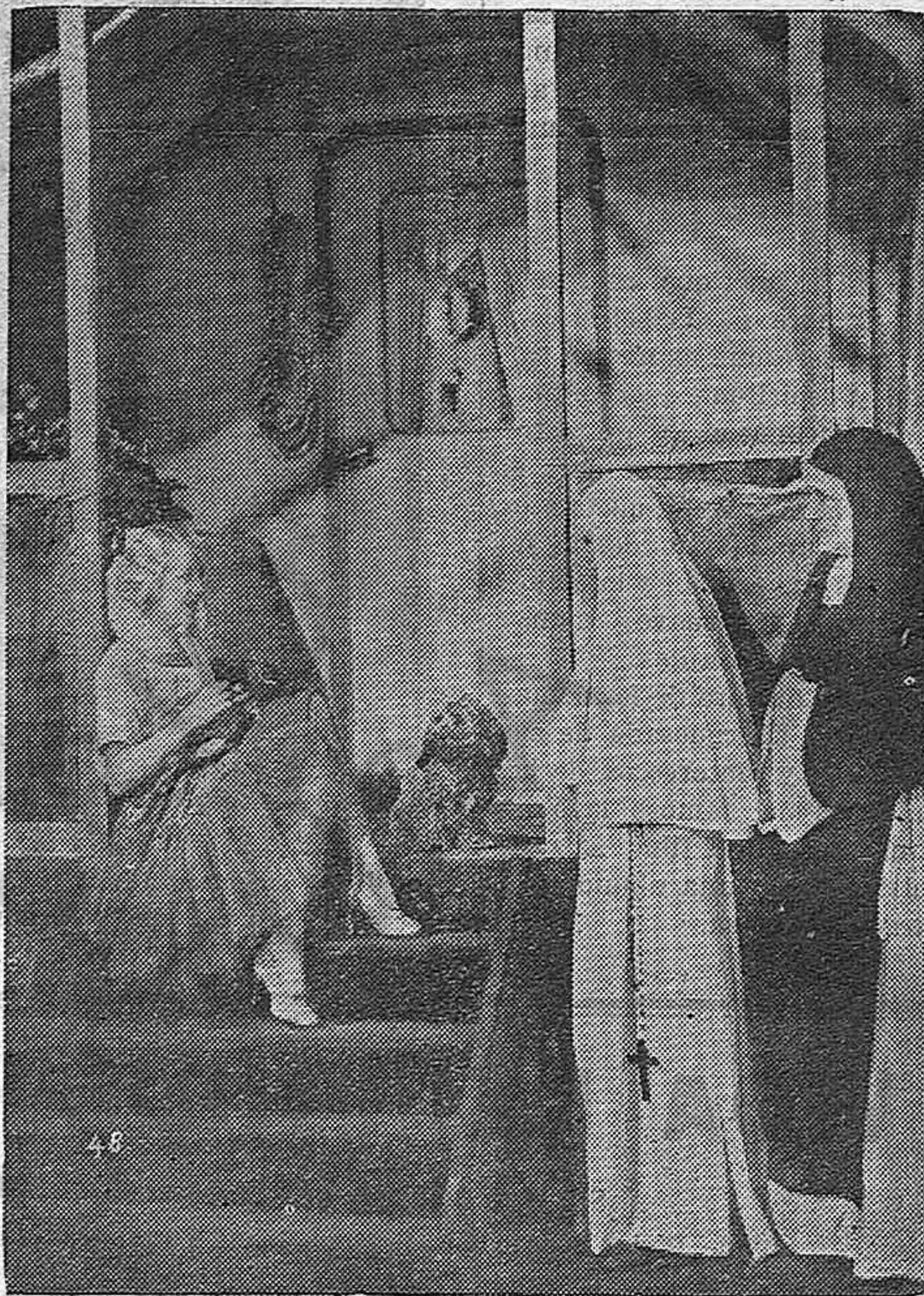
Una escena de la producció alemana "La santa y el loco" que distribuye CIFESA en la actual temporada