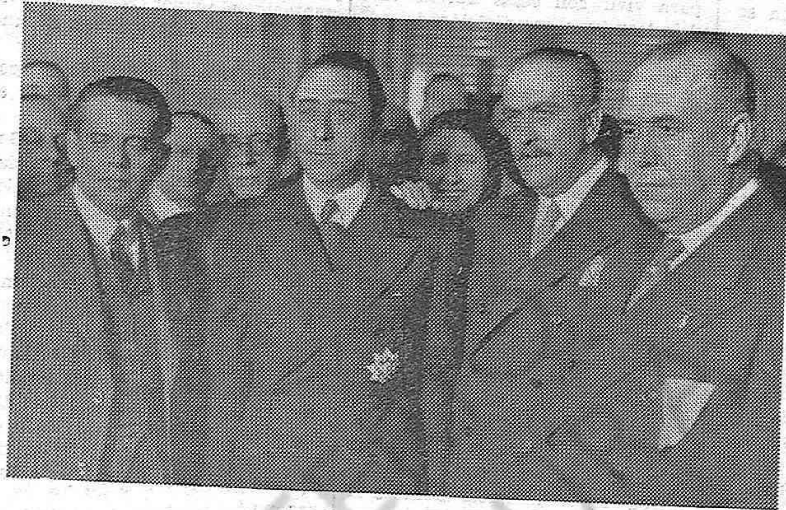
EN EL MINISTERIO DE LA GOBERNACION. — MADRID

¡Católicos, que queréis el triunfo de vuestras ideas, no cerréis vuestros bolsillos y favoreced a vuestros periódicos: es la obra más grande que podéis hacer!