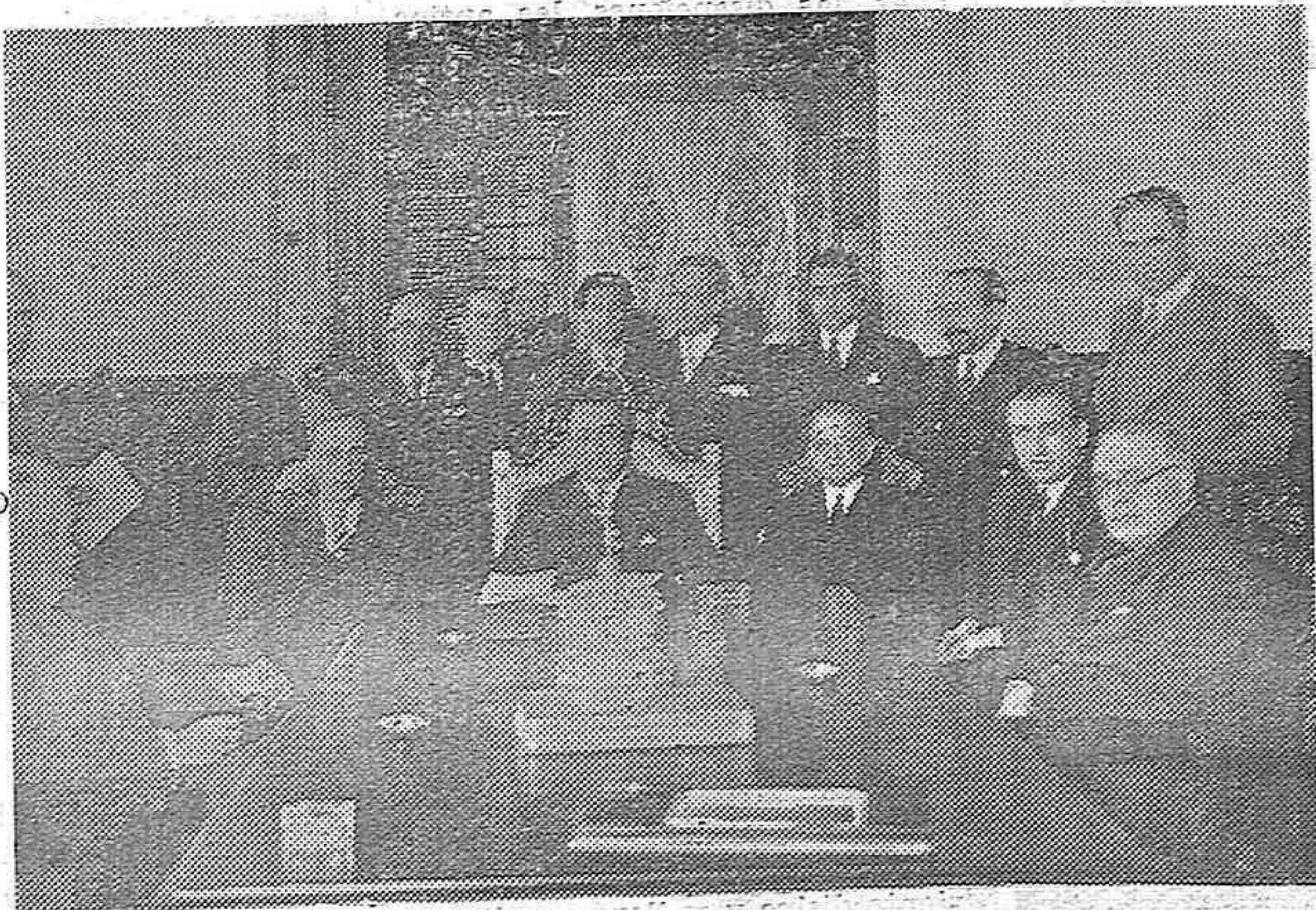
Reunión de fuerzas vivas en el Gobierno civil de Madrid, para tratar de posibles soluciones al paro forzosa