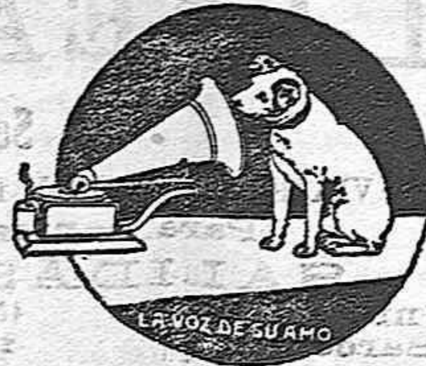
el aparato NO es un «GRAMOPHONE» Catálogos gratis

TITTA RUFFO y CARUSO en discos Gramophone