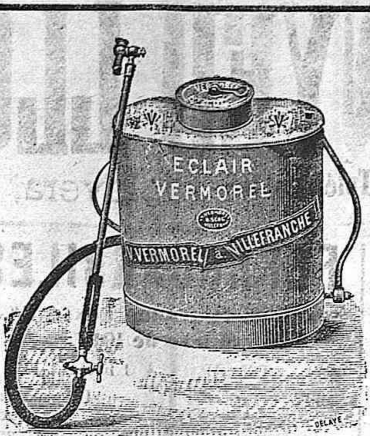
Pulverizadores Vermorel ptas. 50.

(Al lado del fabricante de gorras D. Isidro Pons.)