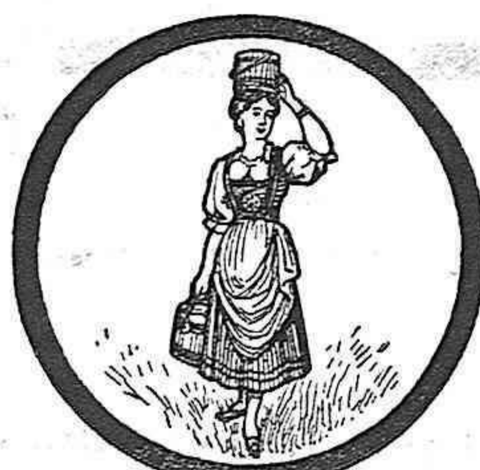
MARCA DE FABRICA

Publica extensa información sobre la muerte del Obispo de Zamora, y entrega de credenciales de nuestro Embajador en Roma. A esta información y á la sección oficial, acompaña información gráfica de la jura de la bandera y festival obrero en Valencia, y fiesta en el Asilo de Jesús, de Madrid. Inserta otras muchas notas de gran interés, por lo que resulta un número altamente atractivo, cuya lectura recomendamos á nuestros lectores.