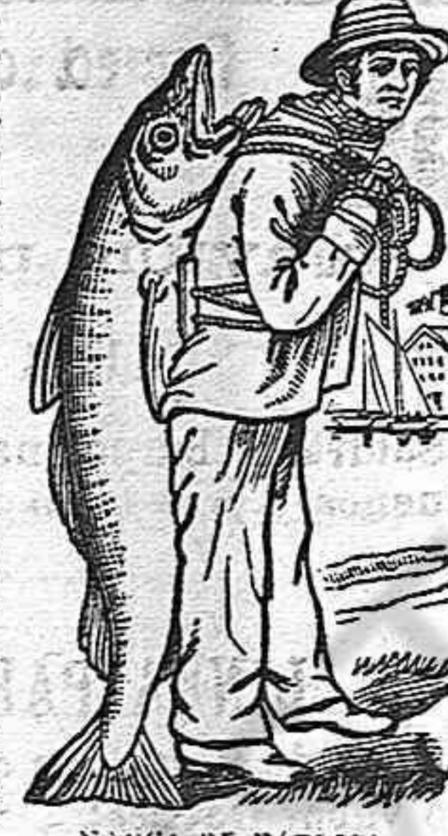
MARCA DE FABRICA