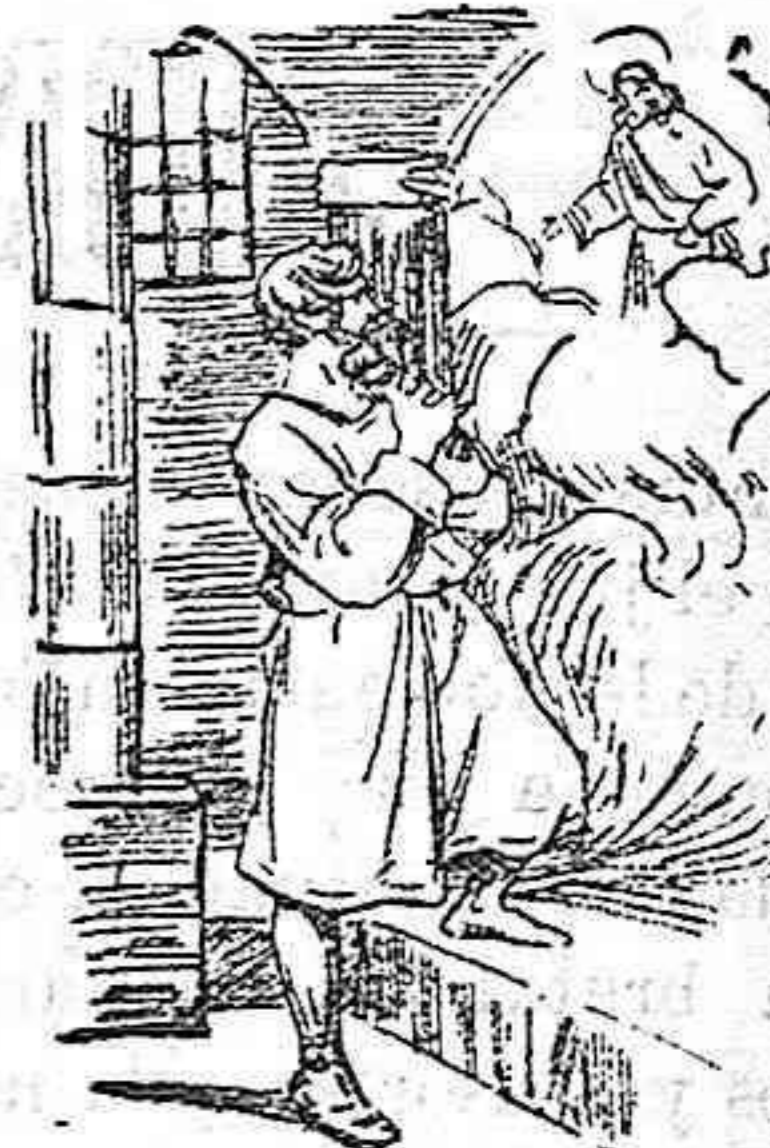
Martirologio: SAN GERMANO

SANTOS DE MAÑANA. San Pedro Pascasio, ob. y mr.