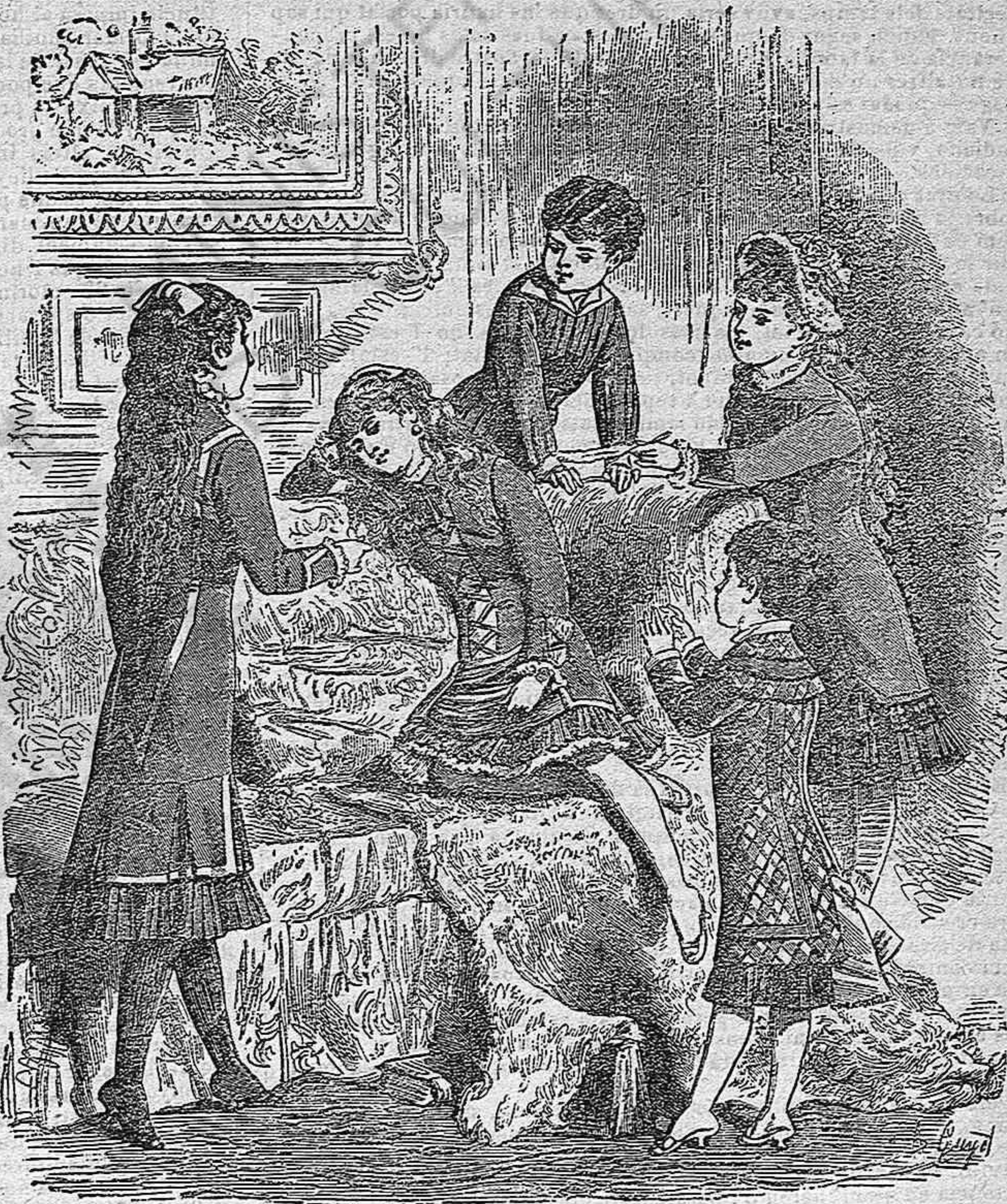
Vestits pera criaturas.

volant de panyo plissé. La costura de l' esquena es cntreoberta en sa part baixa, per donar pas a una cintura en cinta de satí vermell. Triple collet de peluche y panyo.