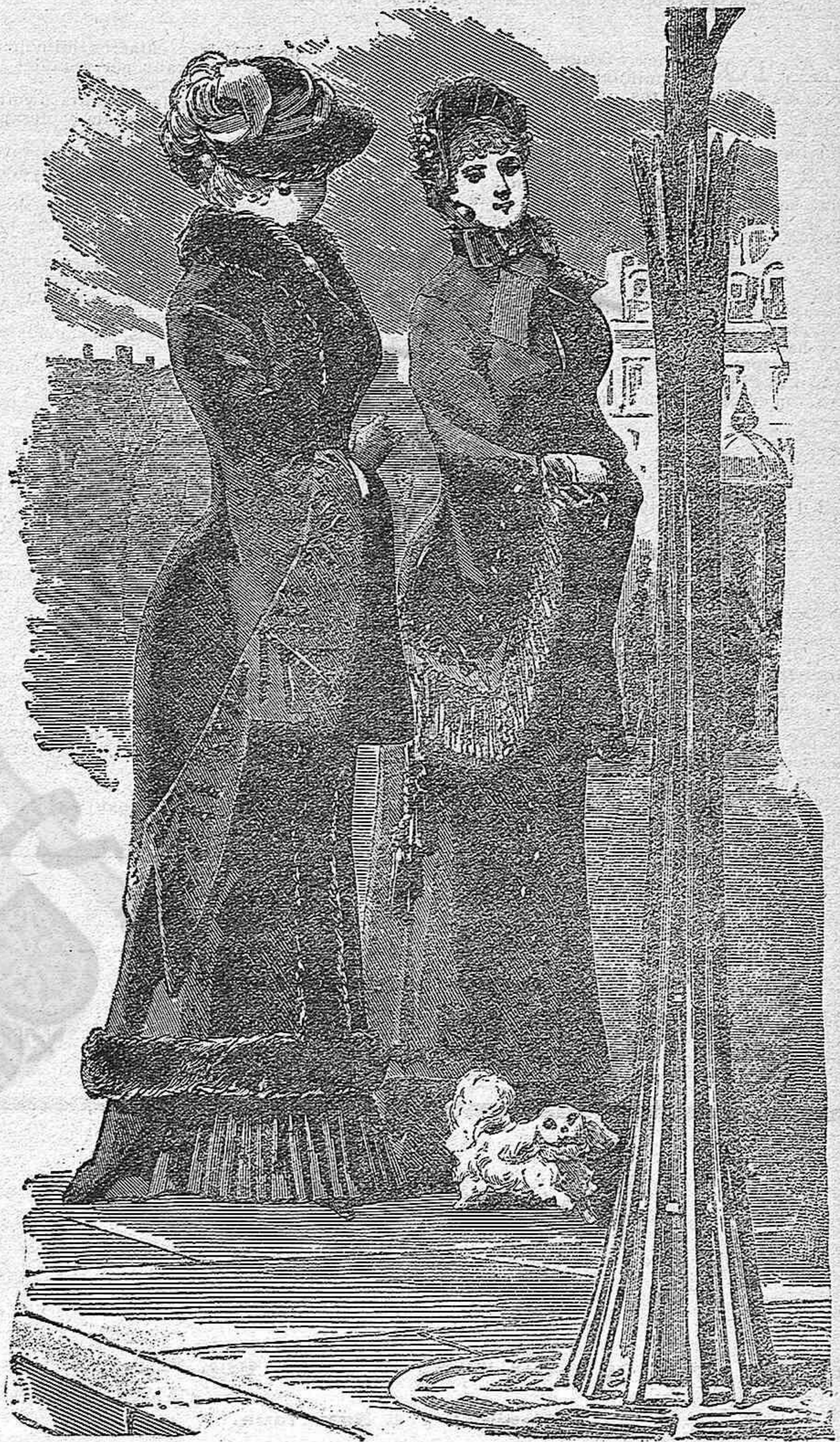
Números 1 y 2.—Nos modelos de confeccions.

Número 1.—Visita Marie-Stuart en satí lutre. Lo cos de la visita se compon del davant y de dos trossos reunits per una costura al mitx de l' esquena, fixantse sa part alta á l' altura de la cintura. Vé després la mànega que passa sobre l' espatlla y 's completa per la pesa de l' esquena. Una petita butxaqueta xa va á l' interior de la mànega. Una pellissa de ploma tot al torn de la visita y una banda de satí festonejat brodat de perlas al entorn de la mànega y de la part d' esquena que forma lo mes alt de la visita.—Sombrero de satí lutre bordejat de peluche ab roba de satí y ram de plumas ombrejadas.