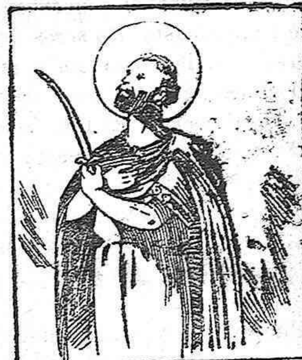
Martirologio. SAN VICENTE DE COLIBRE

SANTOS DE MAÑANA Stos. Timón y Vicente, mrs.