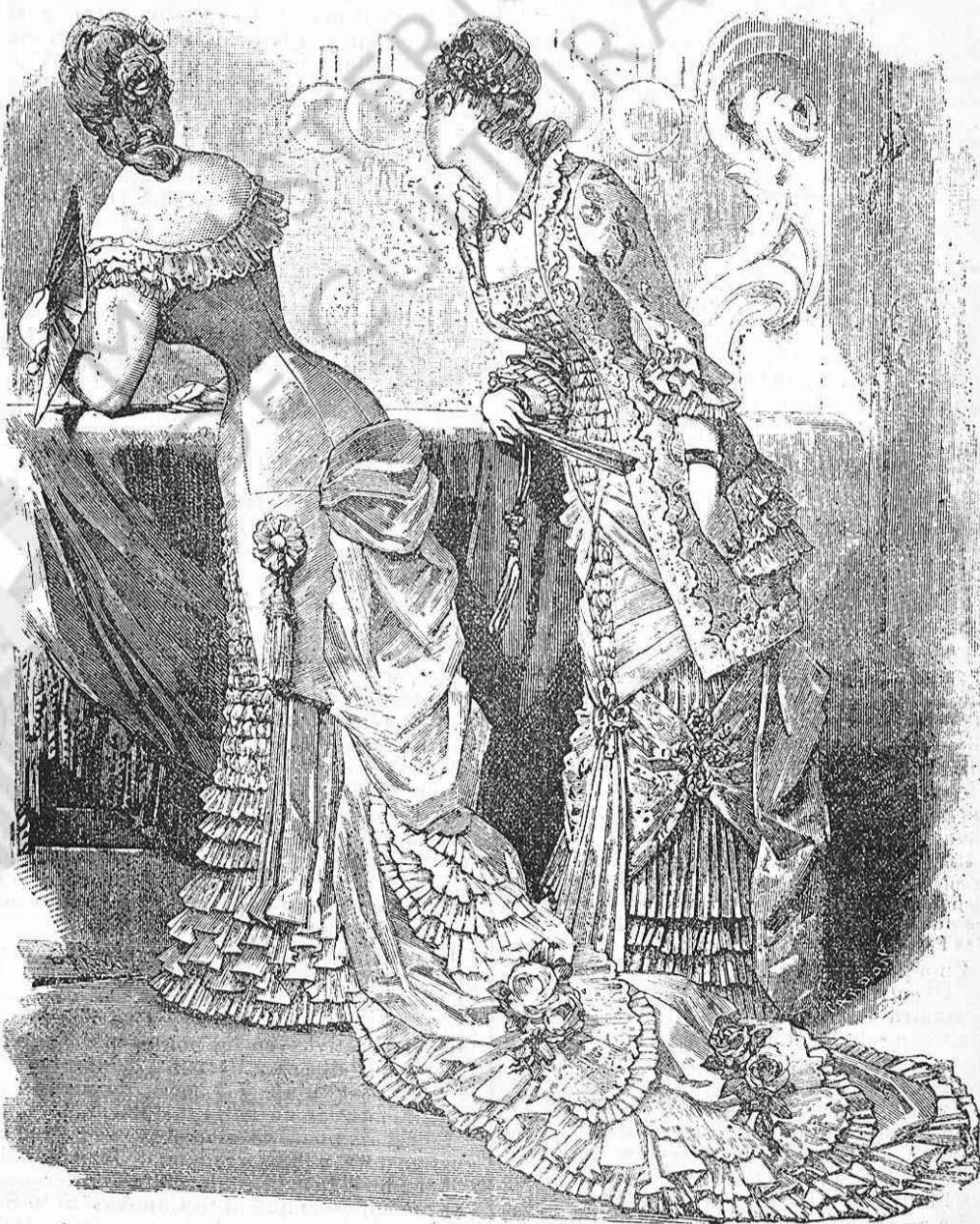
Vestits de ball o teatro.

Núm. 2.—Roba de sati merveilleux blau y brocatell del mateix color.—Faldilla de sati, ab devant plegat y petits plegats en la part baixa. Una escarpa de brocatell atravessa 'l devant, y va agafada als costats ab guarniments de cordoneria. La part alta del