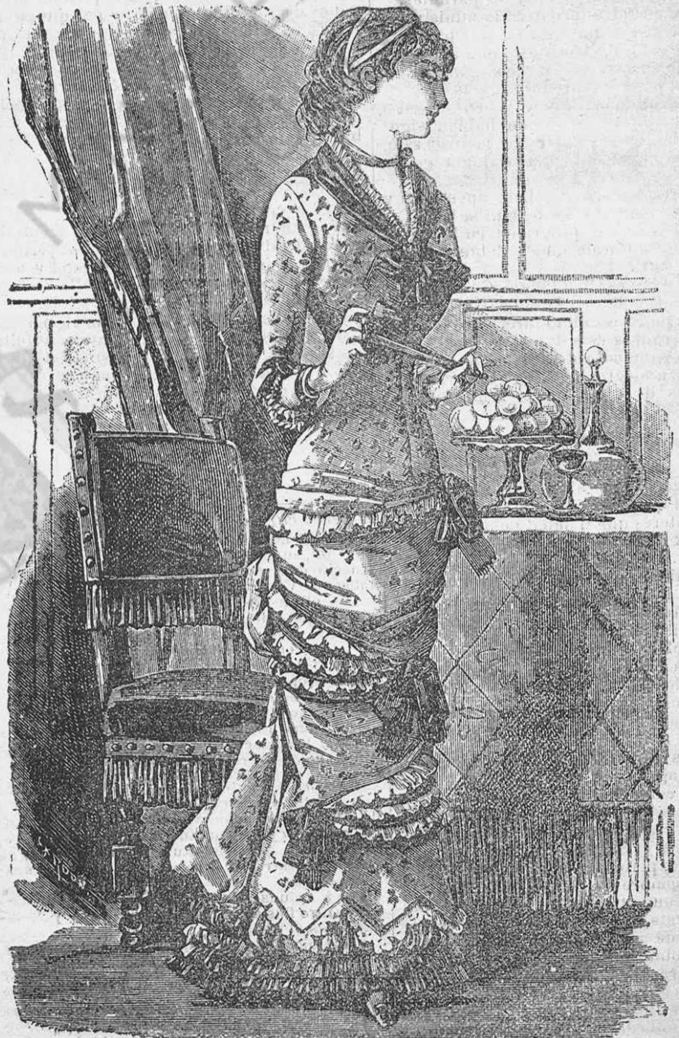
Vestit de dinar,