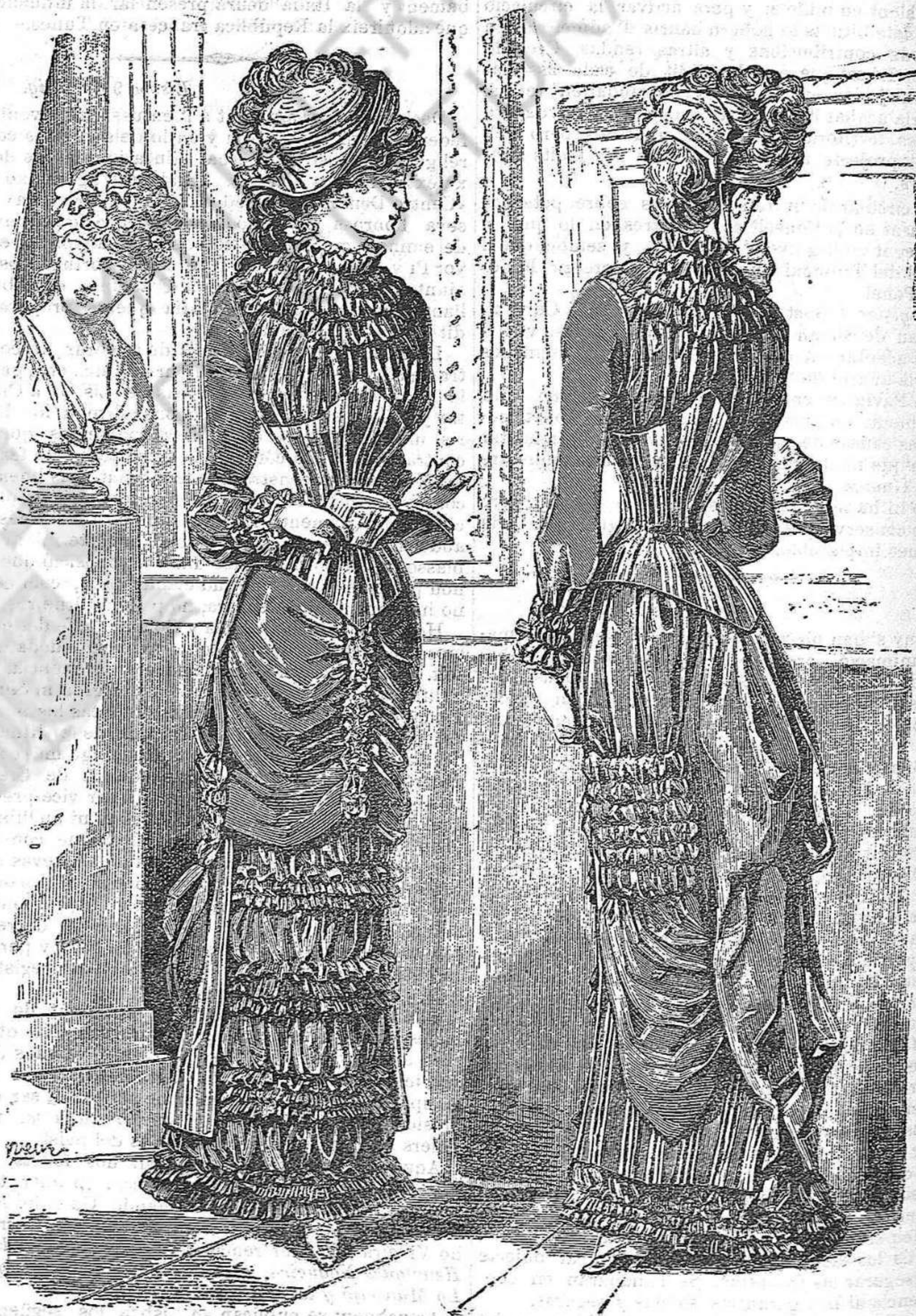
Vestits de Passeig.