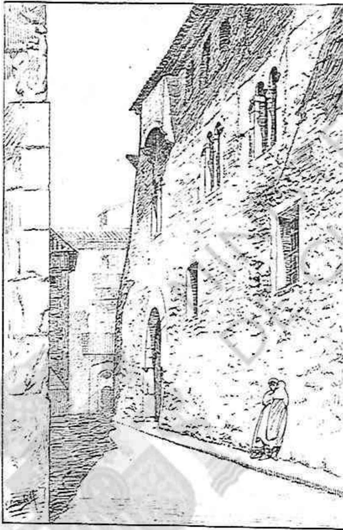
Castell de la Geltrú

Era llavors rey d' Aragó en Jacme 'l Conqueridor , molt