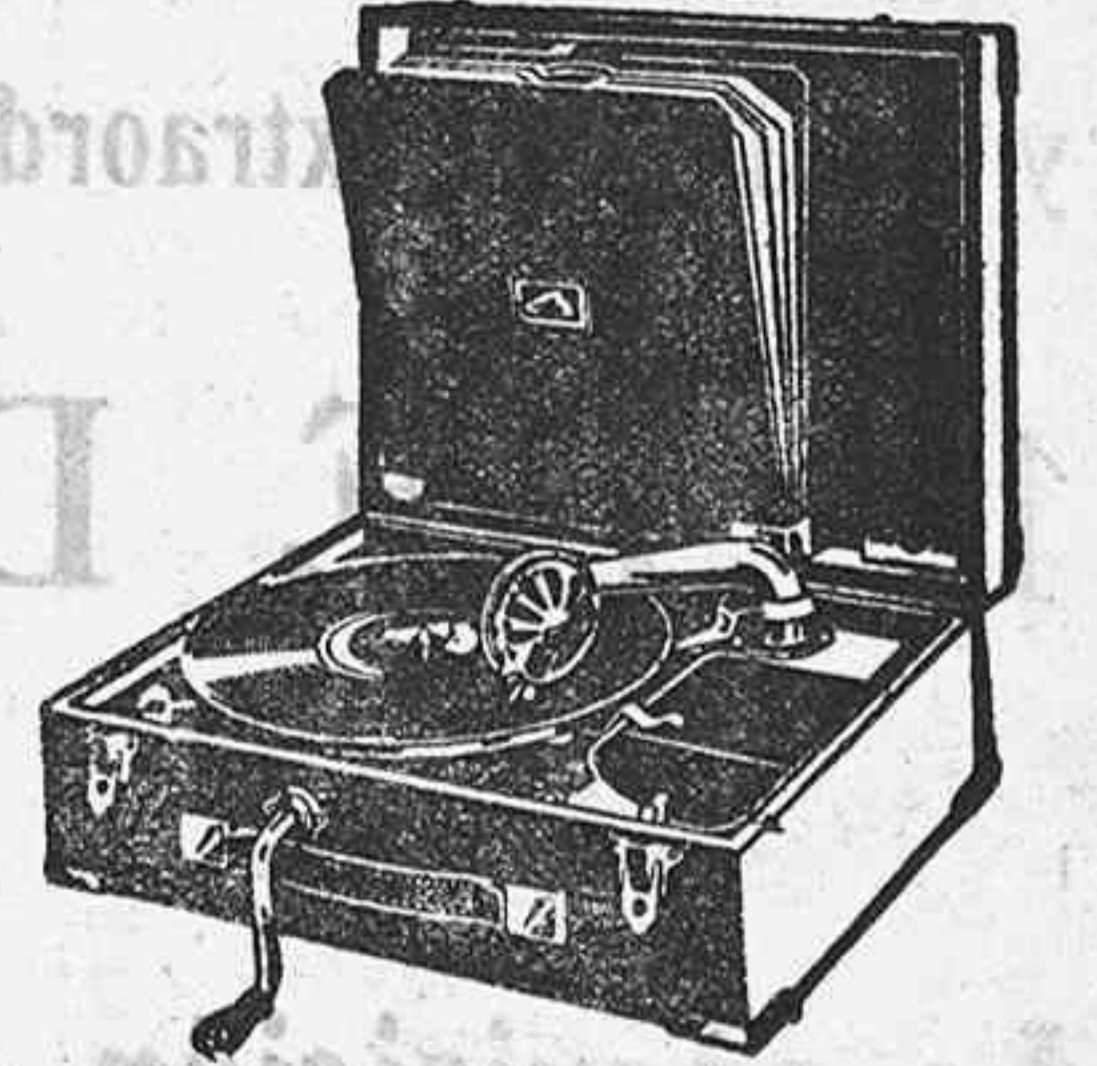
GRAMOLA, 210 ptas.

Relojes pared y bolsillo a precios muy baratos