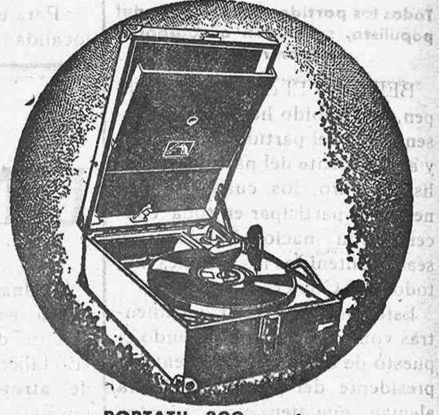
PORTATIL, 300 pesetas

ARTICULOS DE TEMPORADA Braseros, Estufas Salamandras, Caloríferos Burlete, Cocinas económicas, Tubería para estufas Vajilla y Cristal