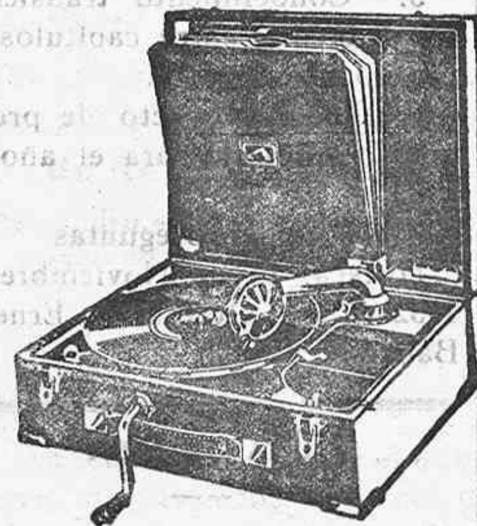
GRAMOLA, 210 ptas.

Relojes pared y bolsillo a precios muy baratos