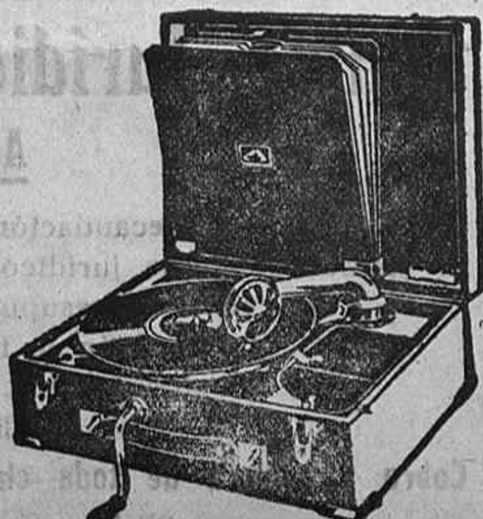
GRAMOLA, 210 ptas.

Relojes pared y bolsillo a precios muy baratos