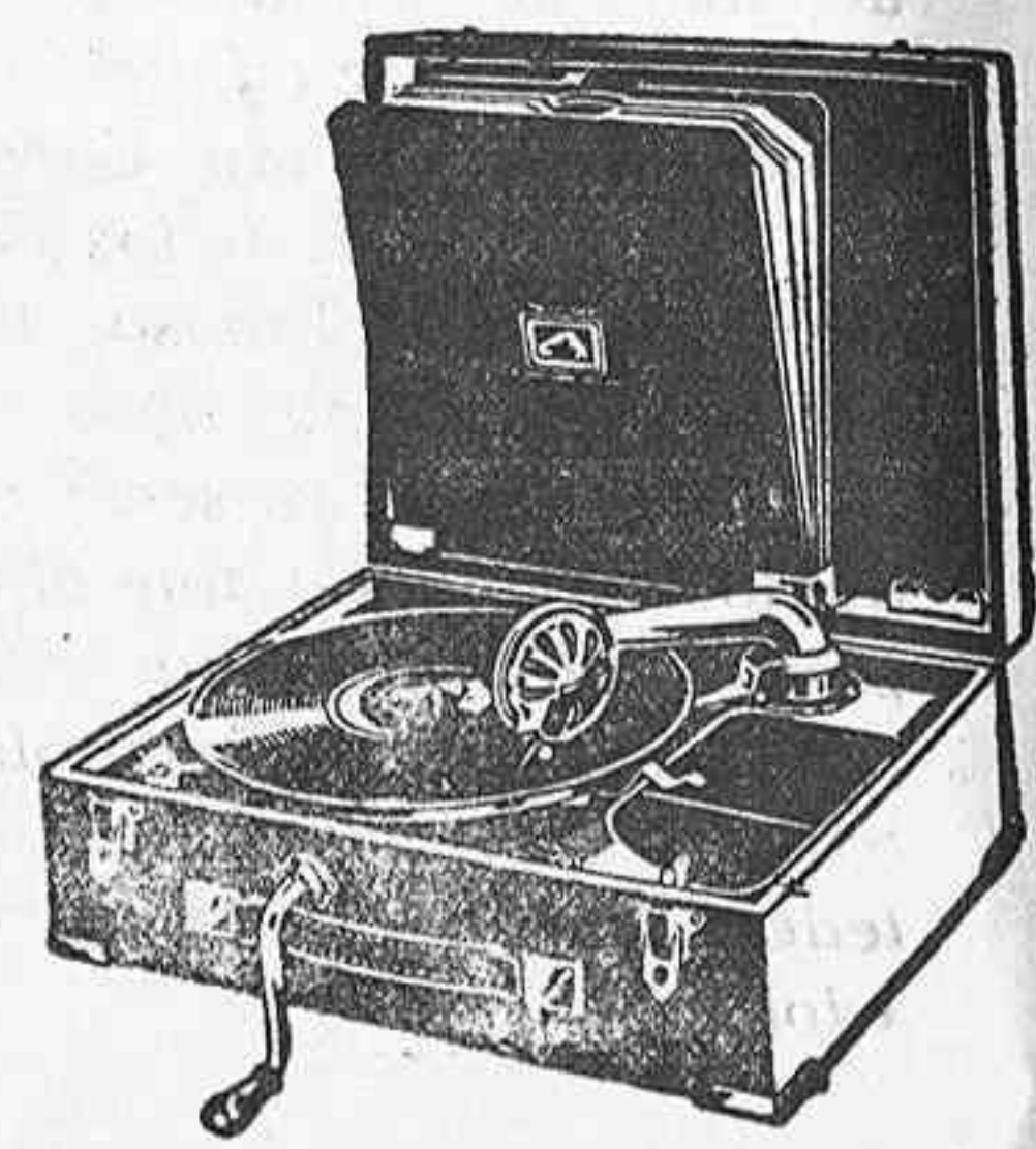
GRAMOLA, 210 ptas.

hay establecidos precios económicos a base de marcas de reconocido nombre