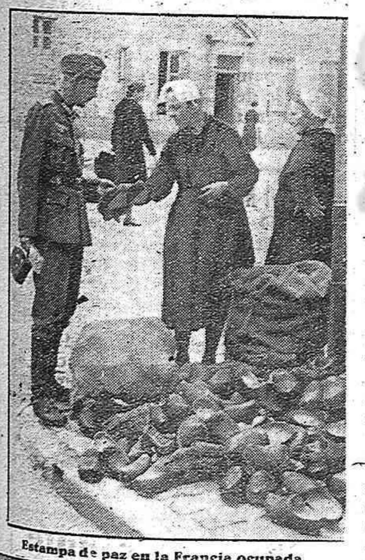
Estampa de paz en la Francia ocupada