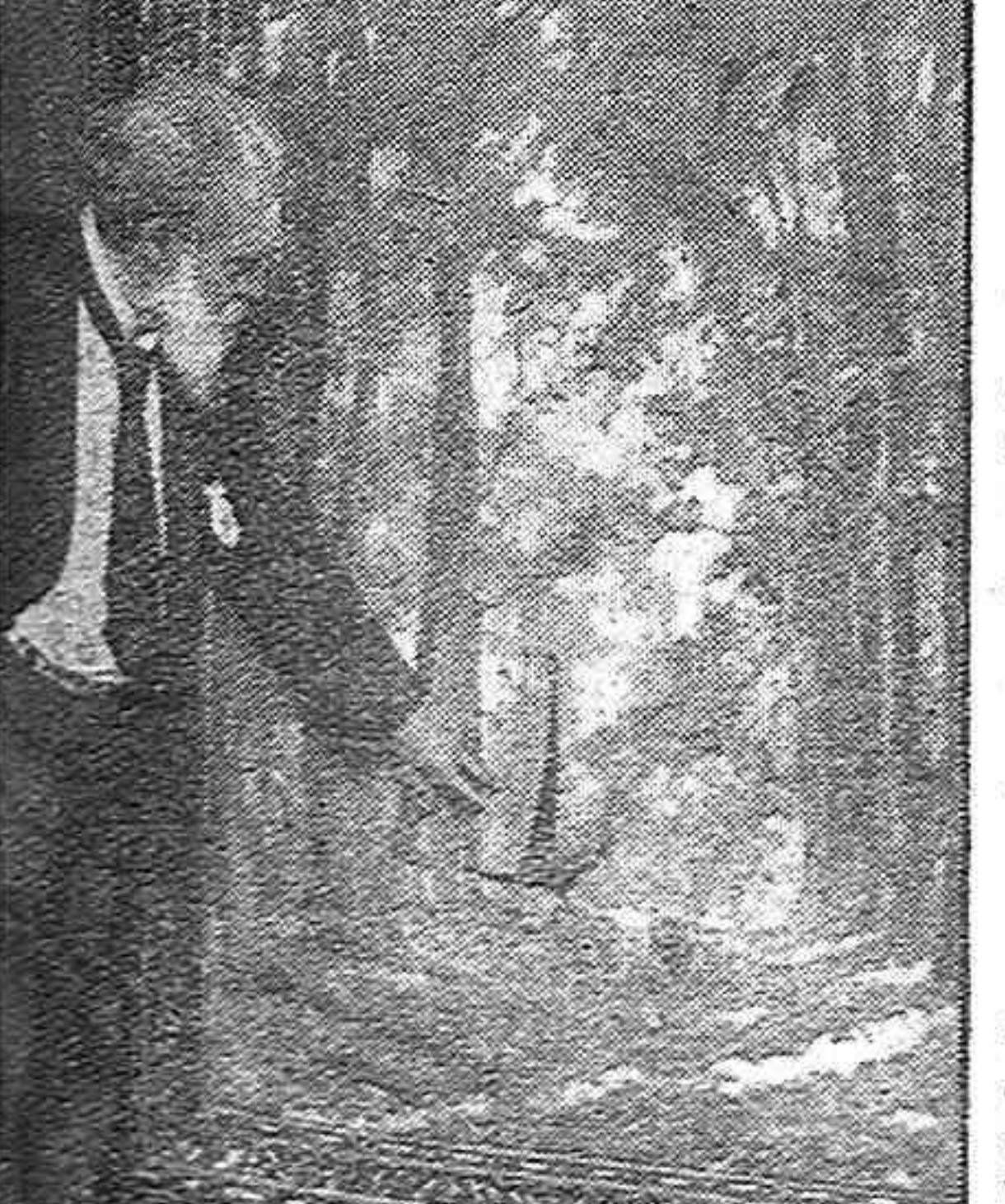
Un piloto belga Henrik «nyten» enseña los destruidos que las fuerzas aliadas causaron en sus mejores cuadros