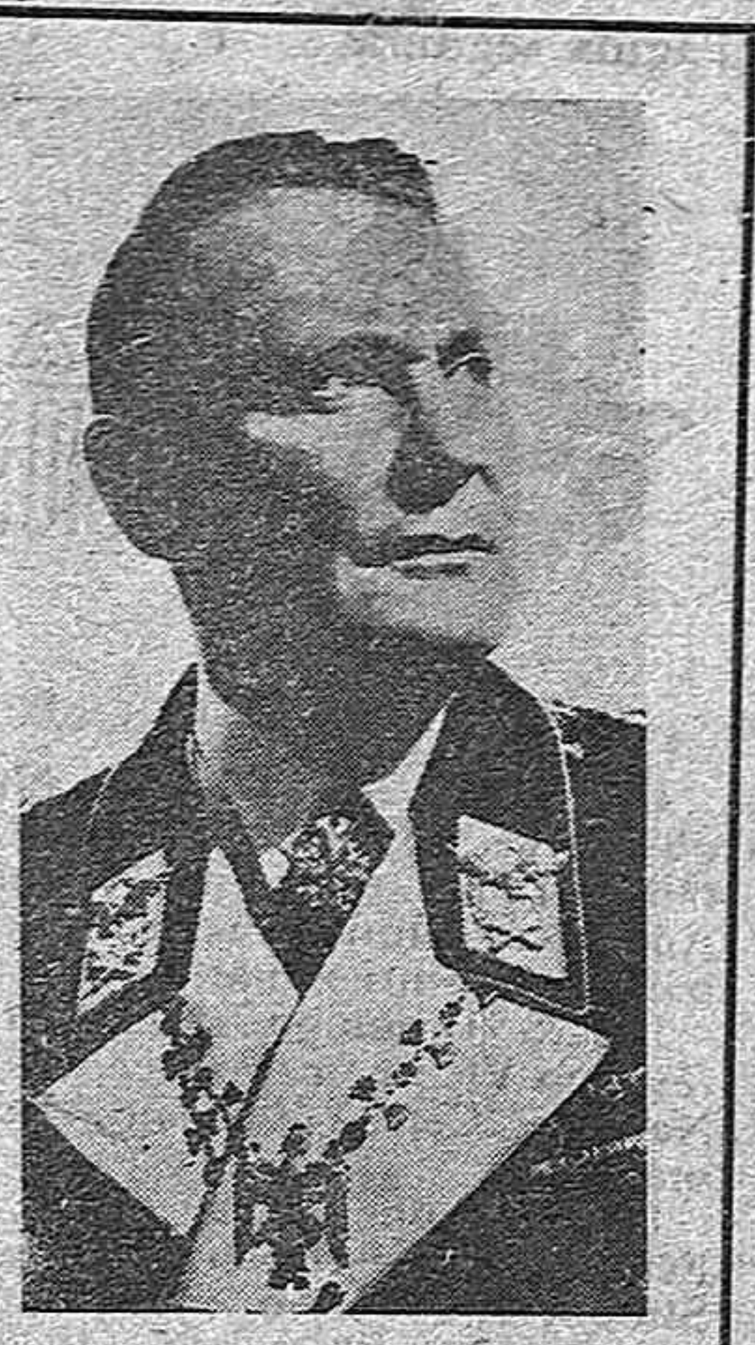
Goering, creador de la potencia aérea alemana, que ha sido ascendido por el Führer a la categoría extraordinaria de «Mariscal del Reich».

Roma, 25.—Dice la radio que Guigurt y Mancioescu, ministros rumanos, han llegado a Salburgo, siendo recibidos por el Führer y von Ribbentrop. (Efe)