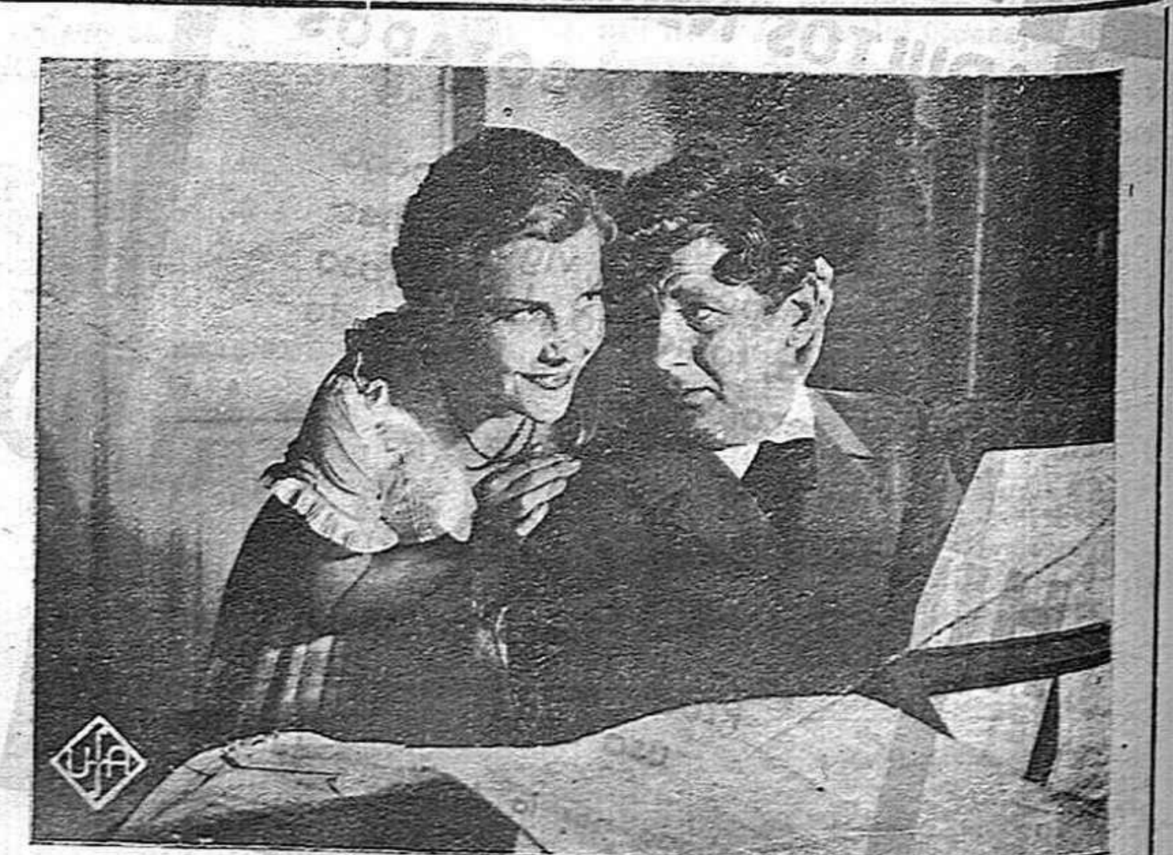
Una escena de la maravillosa opereta cinematográfica de la UFA, GUERRA DE VALSES, que el domingo se estrenará con carácter de acontecimiento en el IDEAL

Yo soy partidario de la ampliación de la plaza, reco-