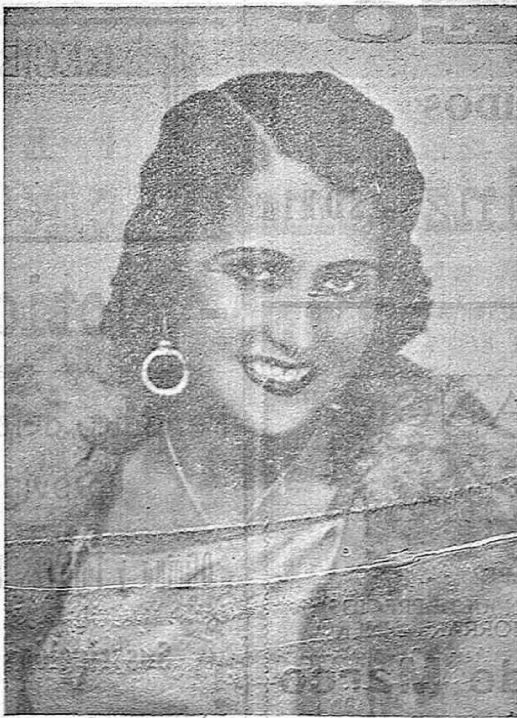
Formidable estrella de Espectáculo «Estrellita de Castro» que mañana debuta en el