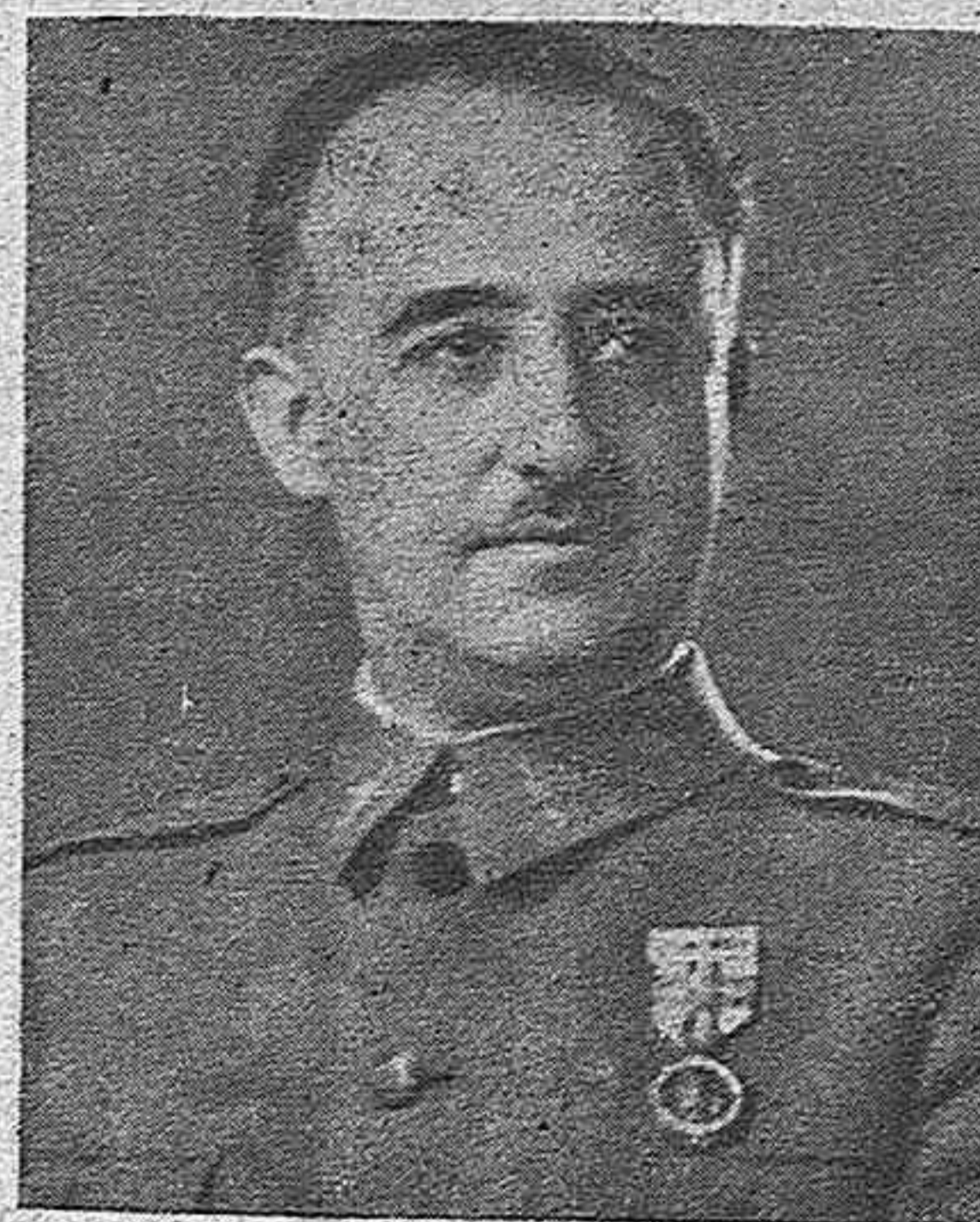
FRANCO, Caudillo glorioso de España, en esta hora de victoria rotunda y definitiva la Patria te saluda agradecida con el grito de ¡Arriba España!

La Delegación Nacional de Agricultura de F. E. T. y de las J. O. N. S. saliendo al paso de los rumores que circulan entre los poseedores de aves, ganados etc., referente a que las relaciones estadísticas que el Servicio Nacional de Ganadería (Ministerio de Agricultura) ha solicitado de todas las provincias de la España liberada tiene por objeto la creación de un impuesto o tributo por cabeza, cree un deber hacer constar que tales rumores son completamente falsos y tendenciosos y que denunciará a los propaladores que pretenden entorpecer la ordenación económica que en defensa de la producción Nacional y por ende de sus productores que realiza el Gobierno de Su Excelencia el Generalísimo.