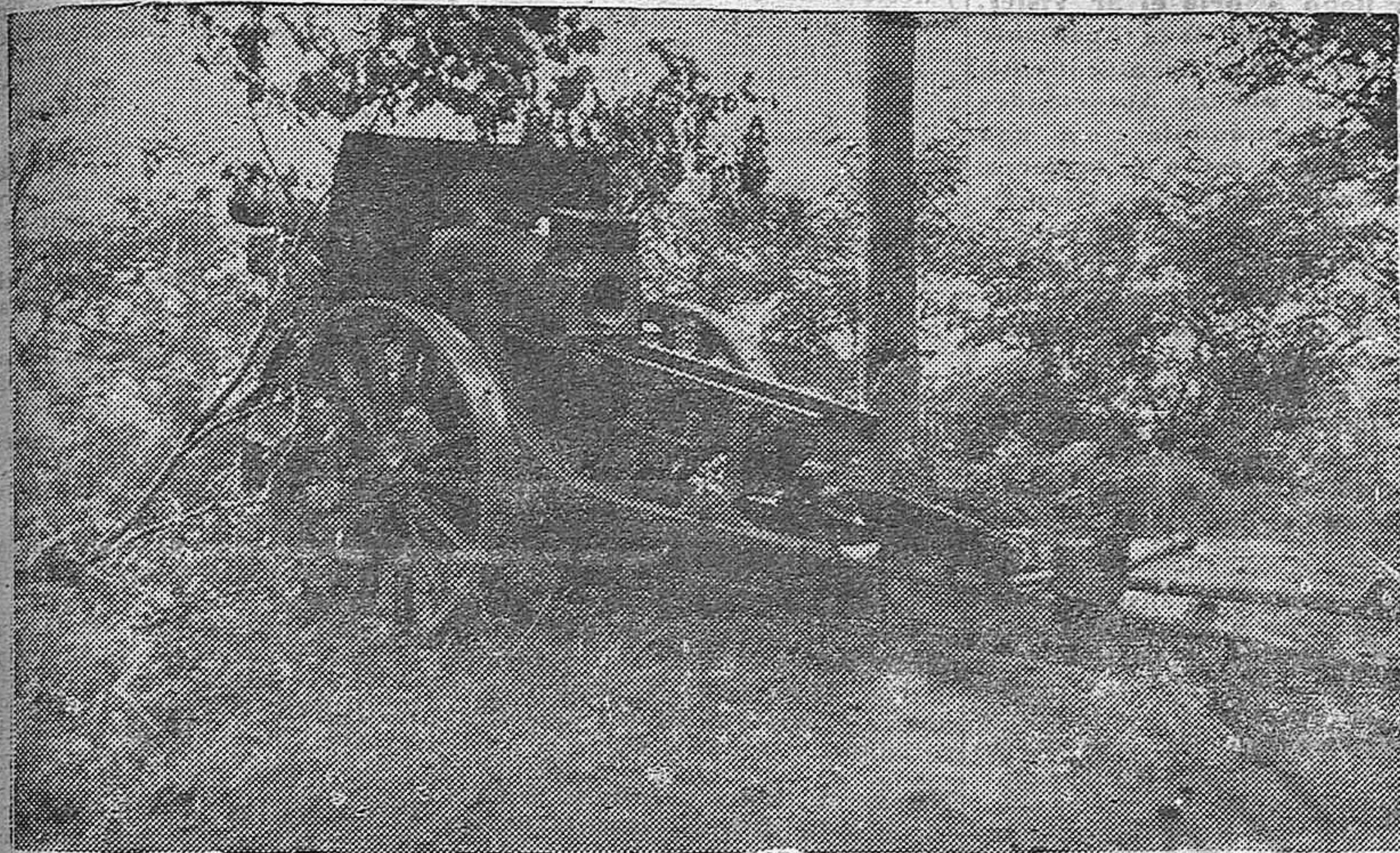
Oculto entre el ramaje, una pieza de artillería nacional castiga duramente el frente enemigo