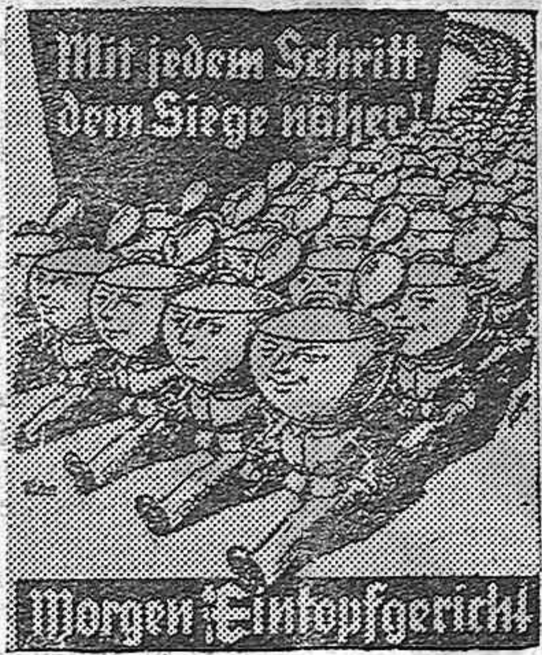
El plato único en Alemania como ayuda del Socorro de Invierno. Cliché que publican los periódicos de Berlín, anunciando el día de ayuno patriótico

Burgos.—Su Excelencia el Generalísimo se ha dignado conceder al Excmo. señor General Von Faupel, Embajador de Alemania en España, la Gran Cruz de la Orden de Isabel la Católica.