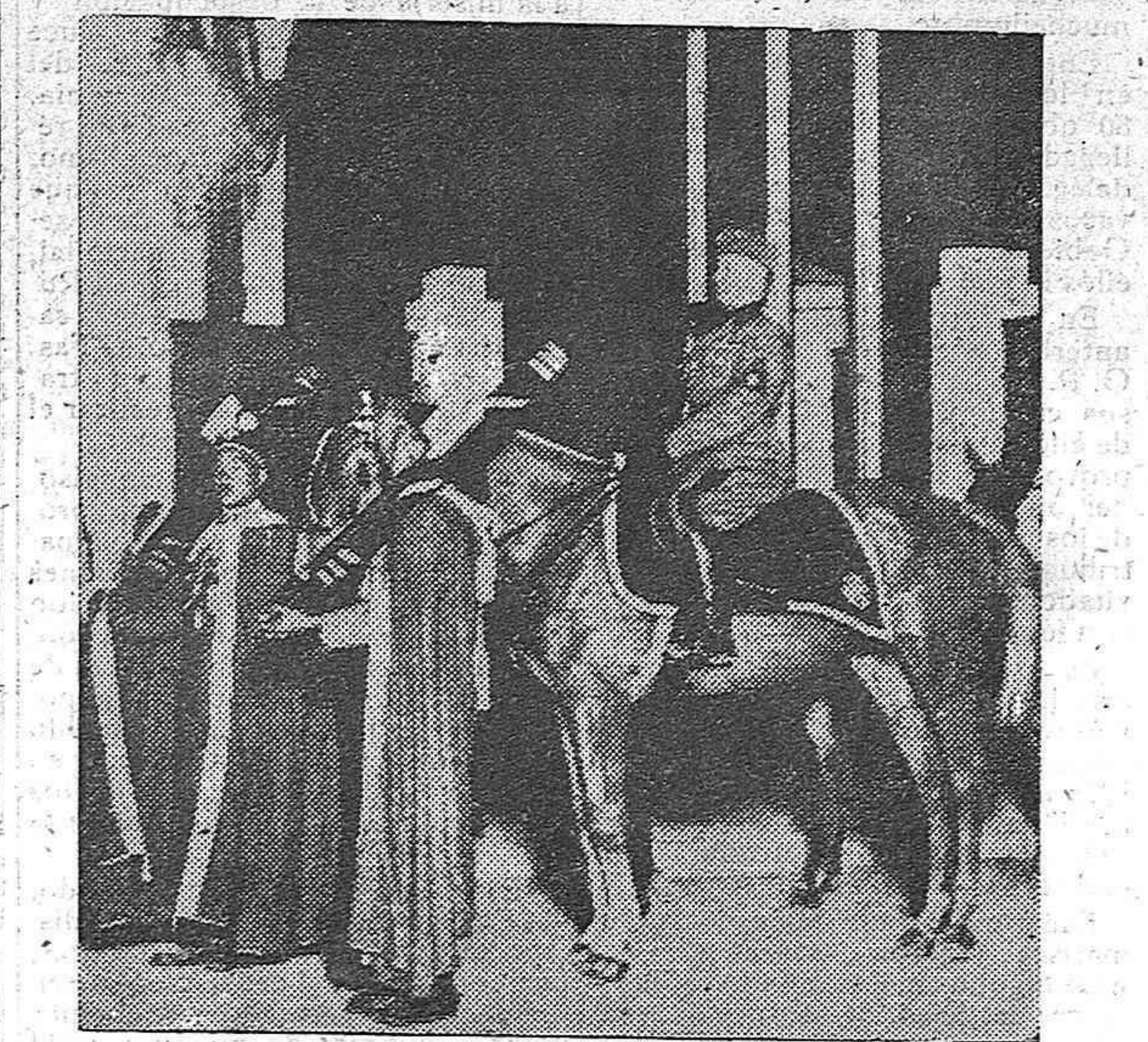
Mussolini, el nuevo César de Italia, que tan magnífico discurso ha pronunciado en Génova, entra en el castillo de Trípoli, escoltado por líctores indígenas