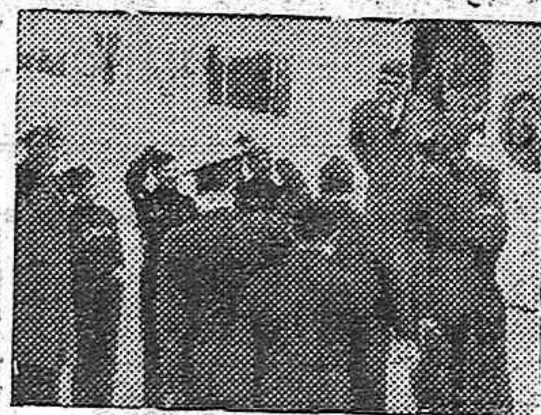
El Conde Ciano saludado a su llegada a Roma

Interesa a todos los asegurados el conocimiento de esta importantísima orden para su más exacto cumplimiento.