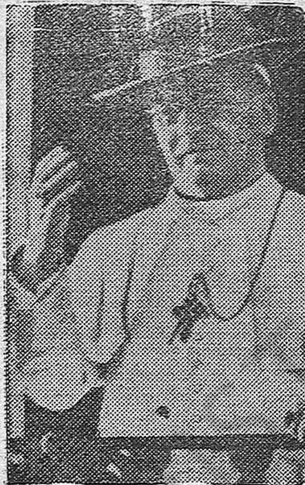
El día 12, en todo el orbe católico, se celebrará el Día del Papa que es el Día de la Catolicidad, de alegría y de fiesta en todos los fieles. Día de España también, porque sólo ella en el mundo, mereció el dictado de Católica.

proporción con la limpieza del terreno conquistado, en donde se encuentran emplazados sierras, corrientes fluviales, y vías de comunicación, de enlace, entre nuestras anteriores y las de nuestra vanguardia. El apunte anecdótico del día de ayer hay que referirlo por la tragedia que podrá tener en lo sucesivo: un tanque que se nos pasó a nuestras líneas con toda tranquilidad y que traía completa toda su tripulación. Preguntados los evadidos sobre la extraña manera de presentarse en nuestras filas, el conductor respondió: es el único modo de pasarse a España con algunas garantías. Viéndolo en tanque ya pueden los rojos ametrallarnos por la espalda.