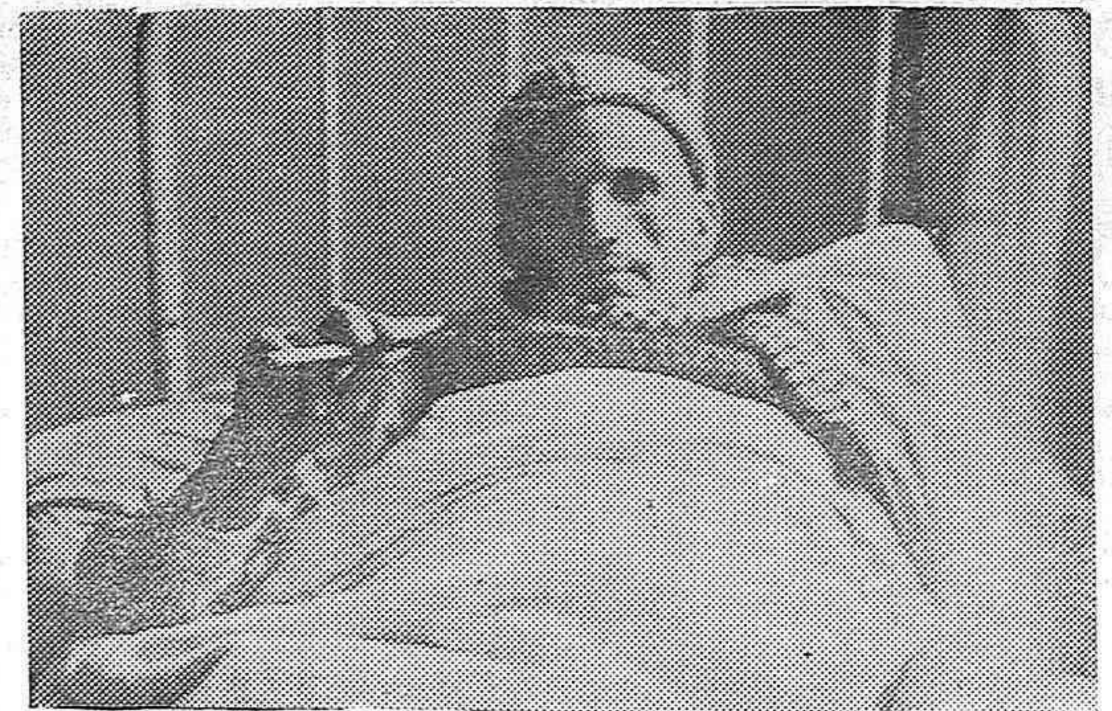
Echado en su cama de héroe herido, el combatiente moro por España posa indolente ante el «objetivo» que por esta vez le toma a él, impidiéndole fumar.

Hagamo que entre nosotros la convivencia humana sea una realidad consoladora. Nuestra hermandad lo exige