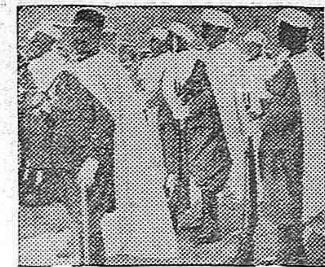
La escolta marroquí del Generalísimo Franco

Esa es España, esa es la raza que forjamos, la que nos envidian en el extranjero. Ese es el eco al mentido triunfo rojo de Teruel; la respuesta que dan los españoles a la mentira internacional y masónica, a la unión de los enemigos de la Patria, de esa España grandiosa que ha conquistado el Norte y que va a conquistar