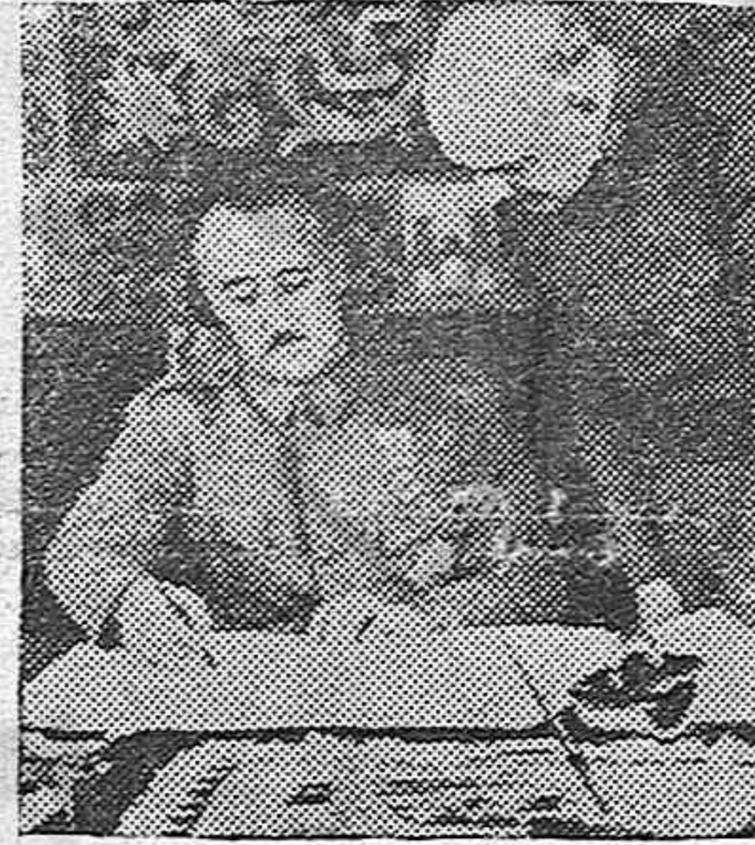
El Generalísimo y el General Moreno despachando asuntos de Estado

«Españoles: Los hechos son más elocuentes que las palabras. La cadena de victorias del año que termina ha tenido un broche. Ese broche es Teruel Tierra aragonesa, española, tierra de sacrificio. Es aquella tierra mellada y soleada que ha dado los héroes de Belchite y hoy produce los héroes de Teruel. Grandeza de la raza española que va por esas