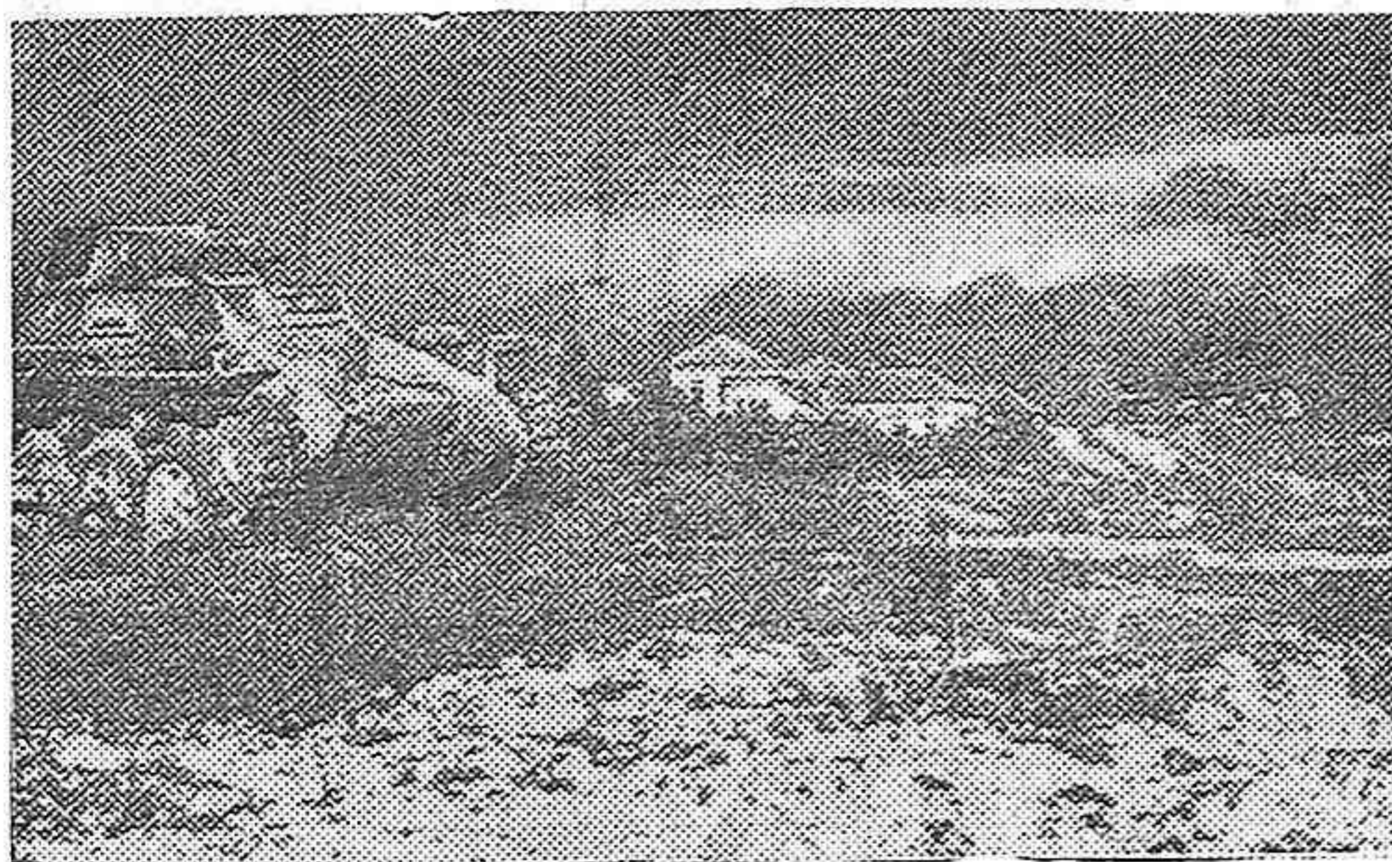
Tanques nacionales evolucionando en una briosa acometida de nuestras tropas

Envíe su donativo a Falange Española Tradicionalista y de las J. O. N. S.