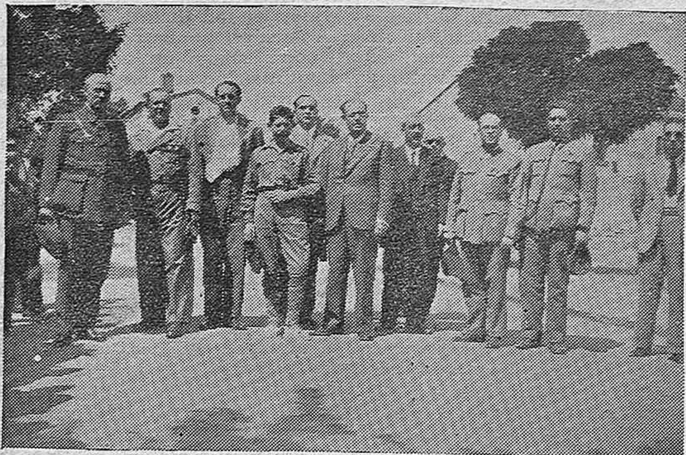
Con motivo de la manifestación de los obreros del Pantano de la Cuerda del Pozo, nuestras autoridades militares y civiles salieron a recibirlos en la entrada de la ciudad. Verlas aquí con dos requetés hospitalizados en Soria de los que ya han salido a derramar su sangre por Dios y por España.