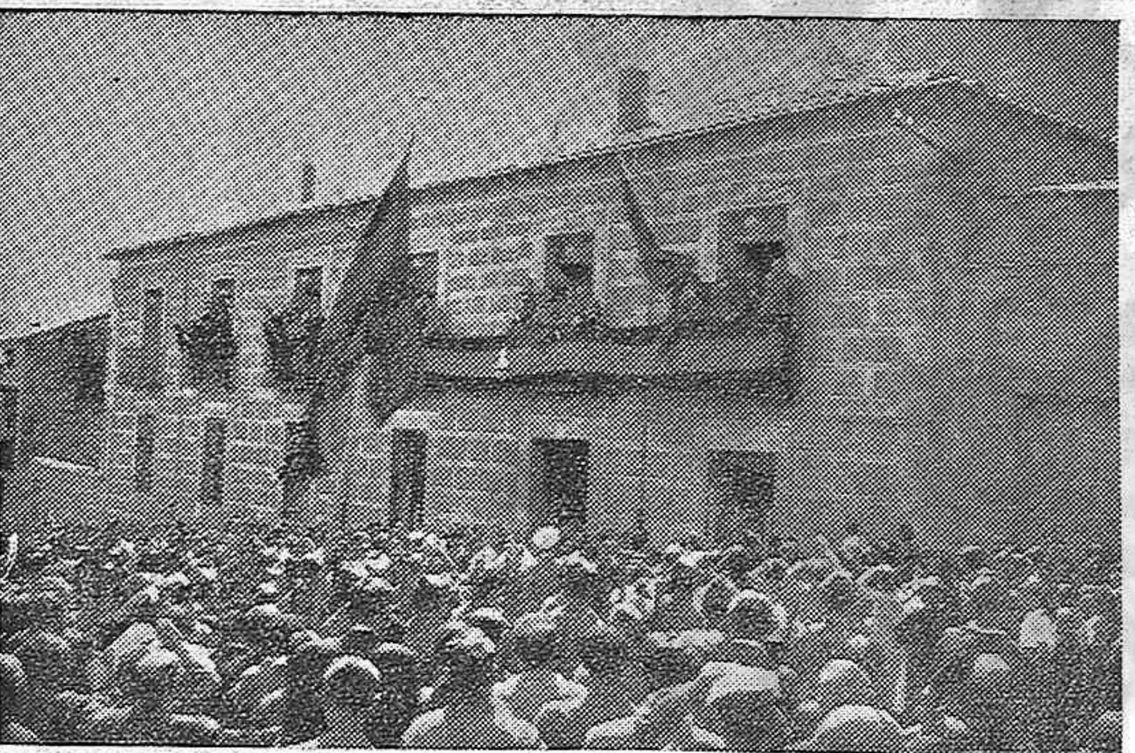
Una muchedumbre enervorizada en su patriotismo presenció el acto solemne de izar oficialmente en el Gobierno Civil la bandera de España. En el primer balcón de la derecha se encontraban las autoridades entre las que se ve al excelentísimo señor Gobernador dirigiendo la palabra al público.