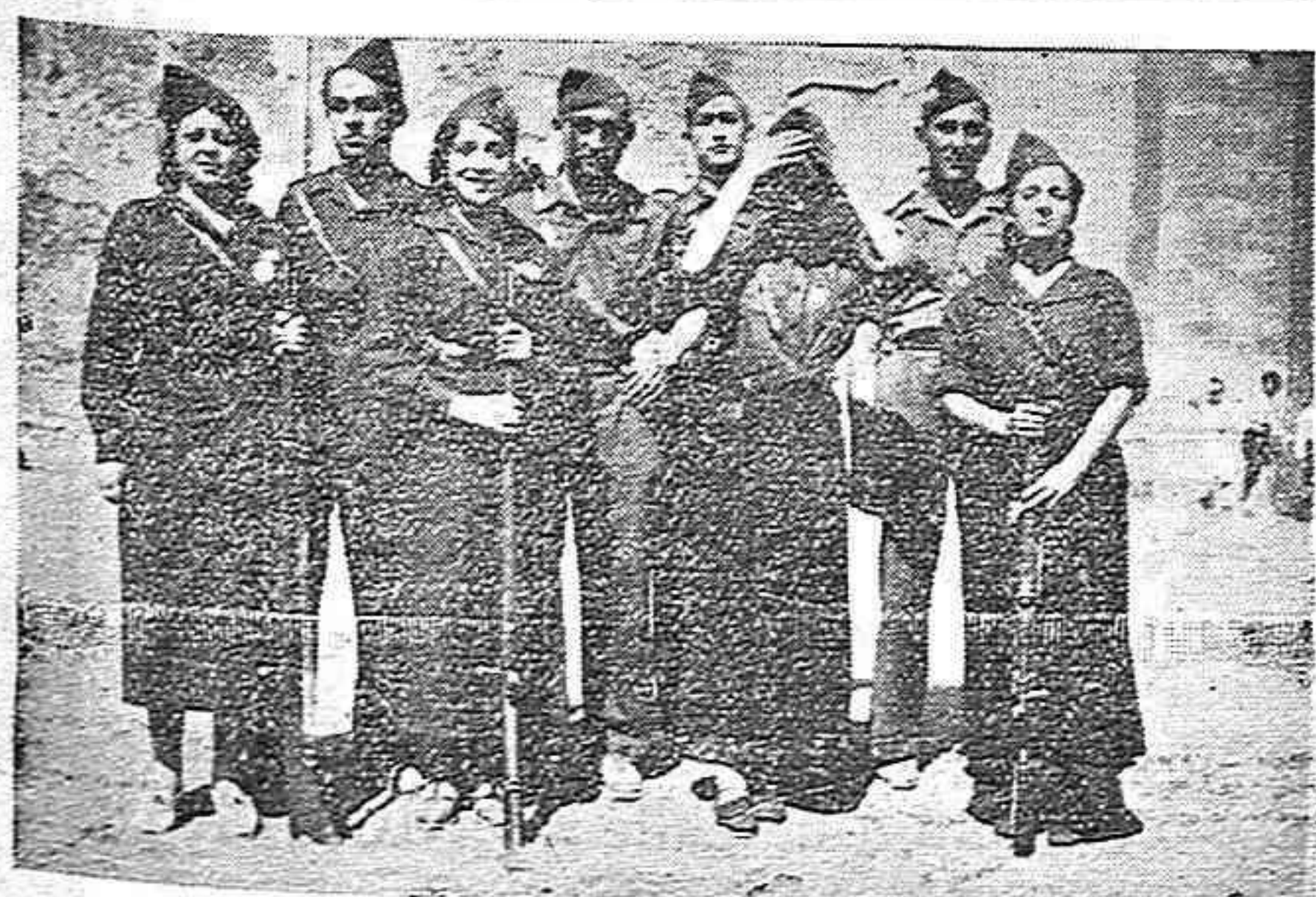
Un grupo soriano de falangistas de ambos sexos