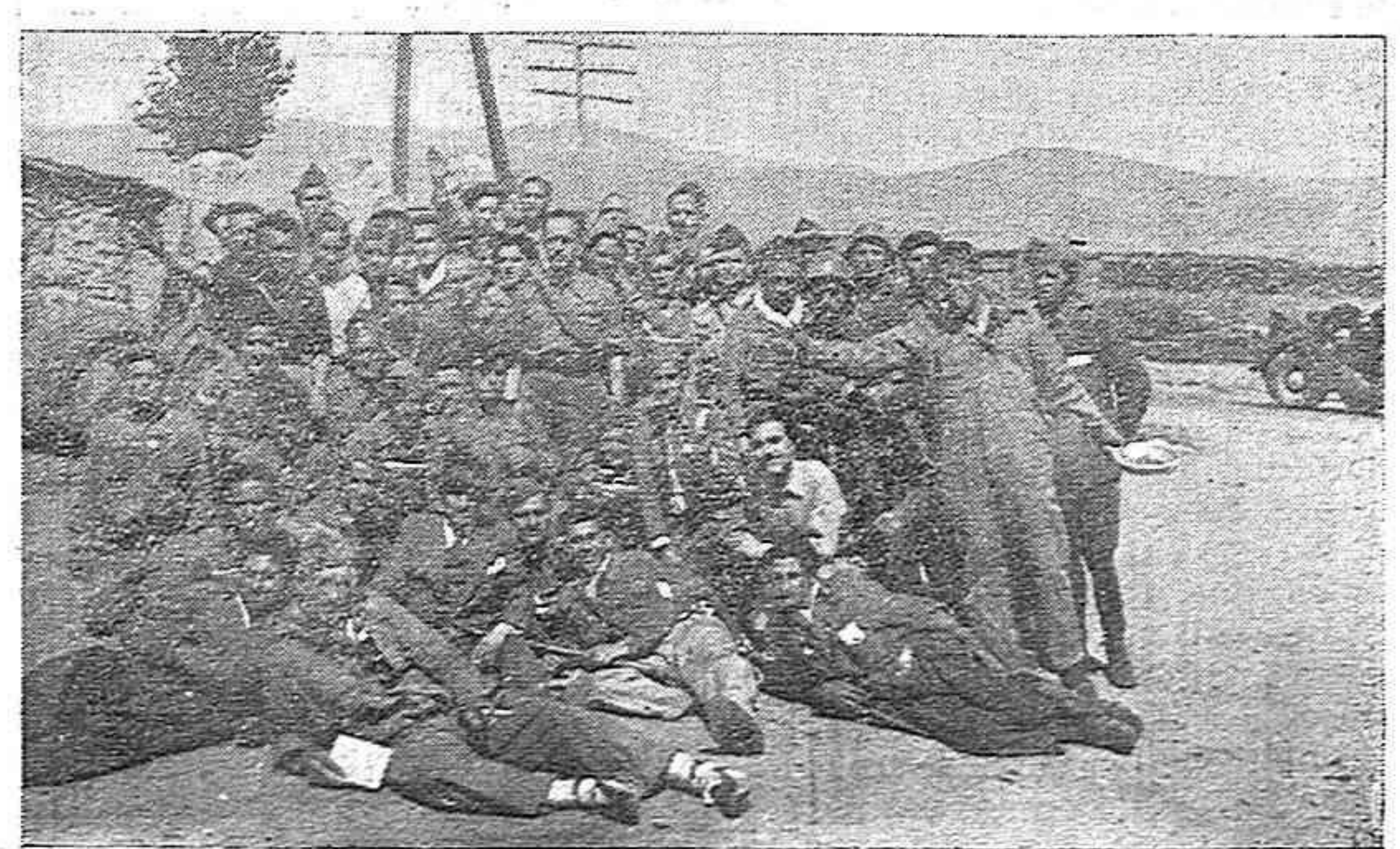
El mismo grupo rodeado de soldados y requetés que operan en las columnas de aquél frente.