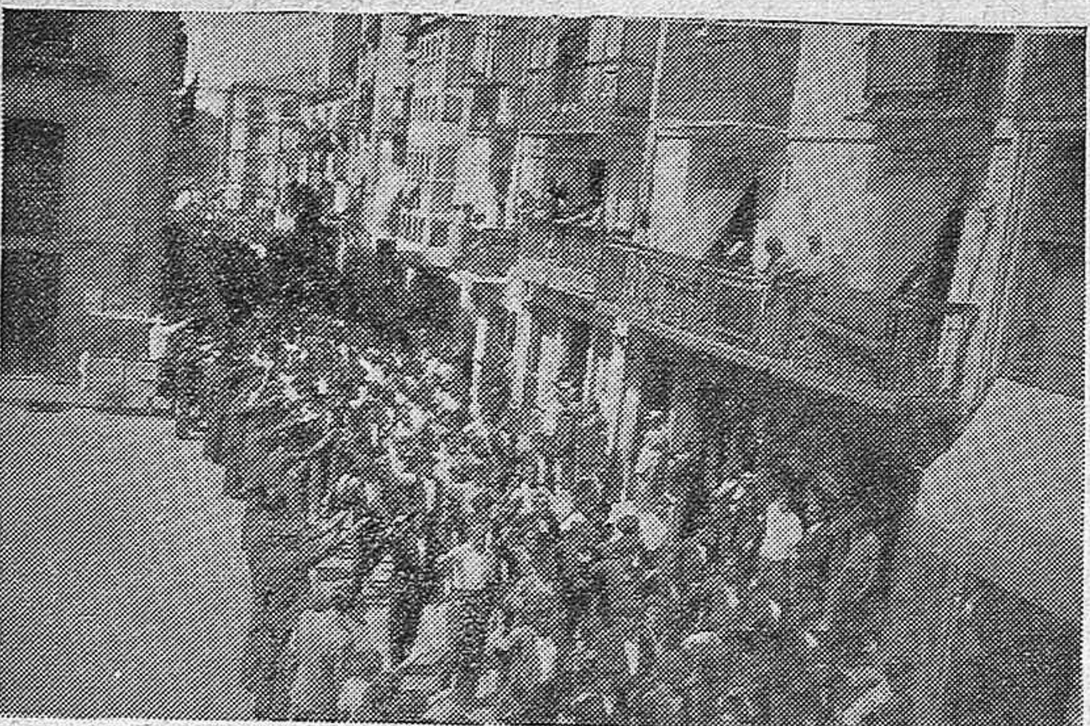
En manifestación ordenada los obreros del Pantano de la Cuerda del Pozo desfilan por la calle Canalejas entre el saludo y las aclamaciones del público.