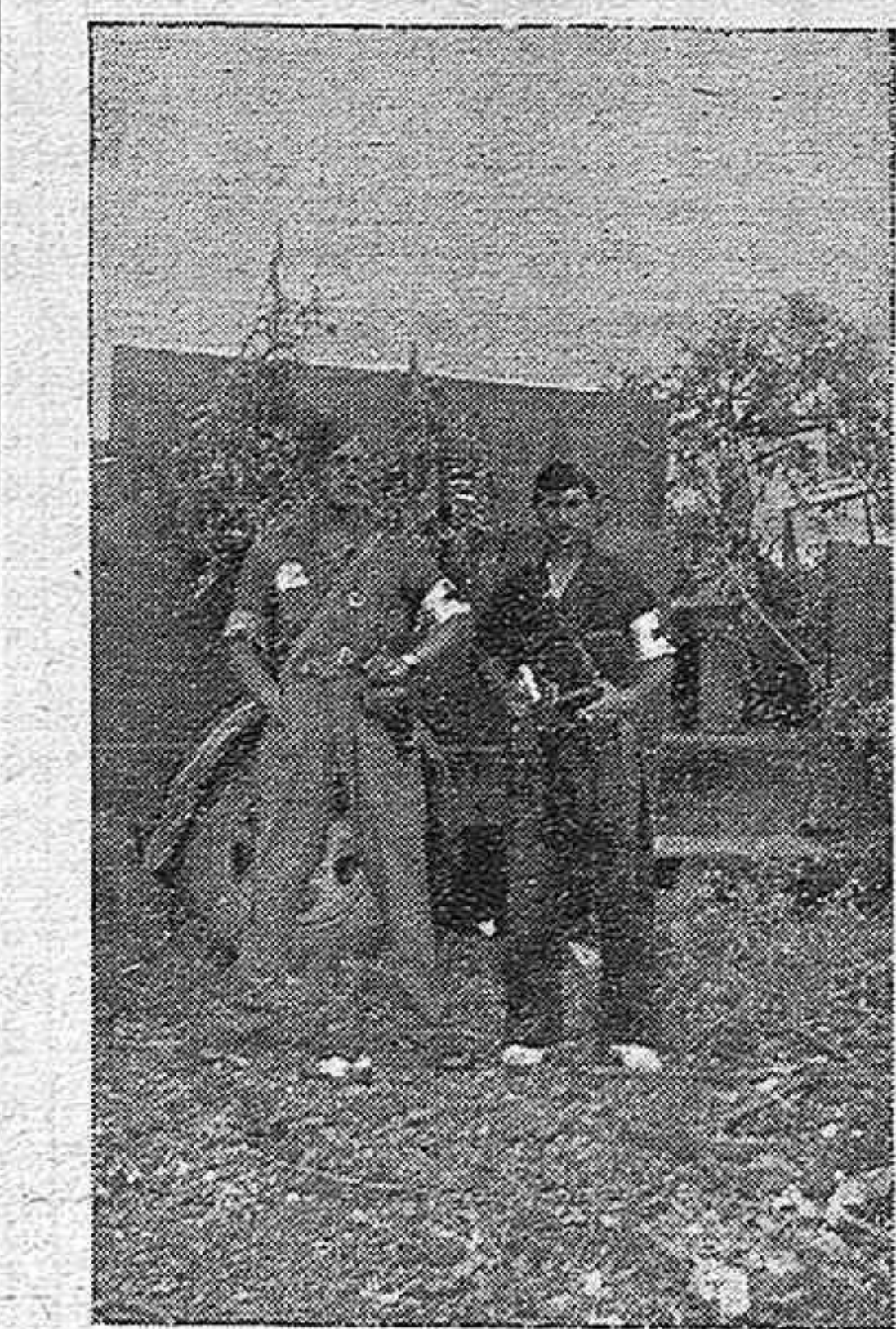
Dos milicianos sanitarios posan ante el fotógrafo en un descanso de las operaciones

Hoy ha habido en España sangrientos combates en el frente de San Sebastián. Las fuerzas nacionales han colocado los puestos de ametralladoras en las alturas próximas a esta población y allí esperan que se rinda de buen grado. De lo contrario se procederá a la ocupación por la fuerza, aunque se cree que habrá poca resistencia.