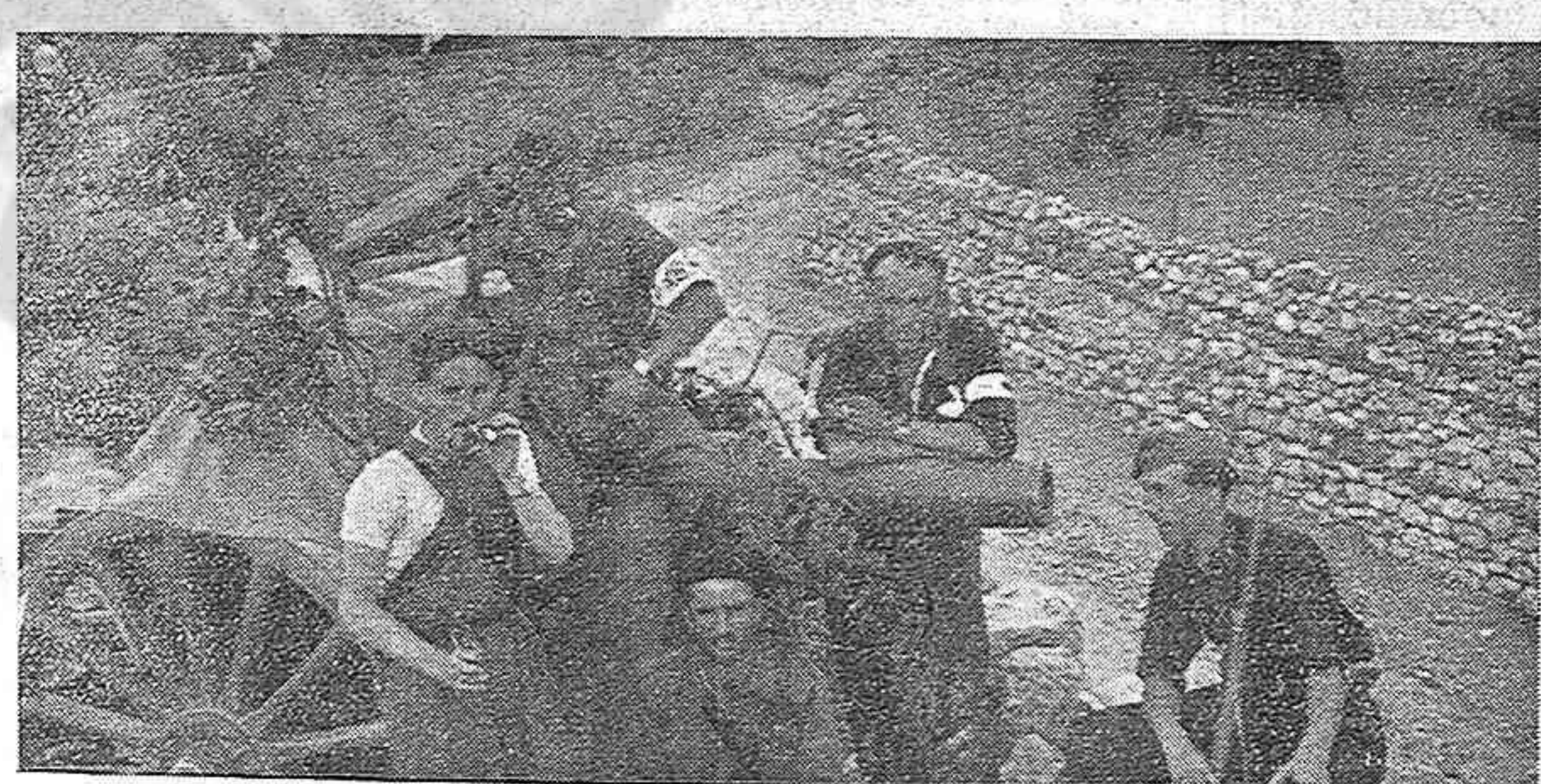
Un cuadro típico de campaña

Lo hacemos público para que los alumnos de dicho centro docente no se incorporen hasta la fecha indicada.