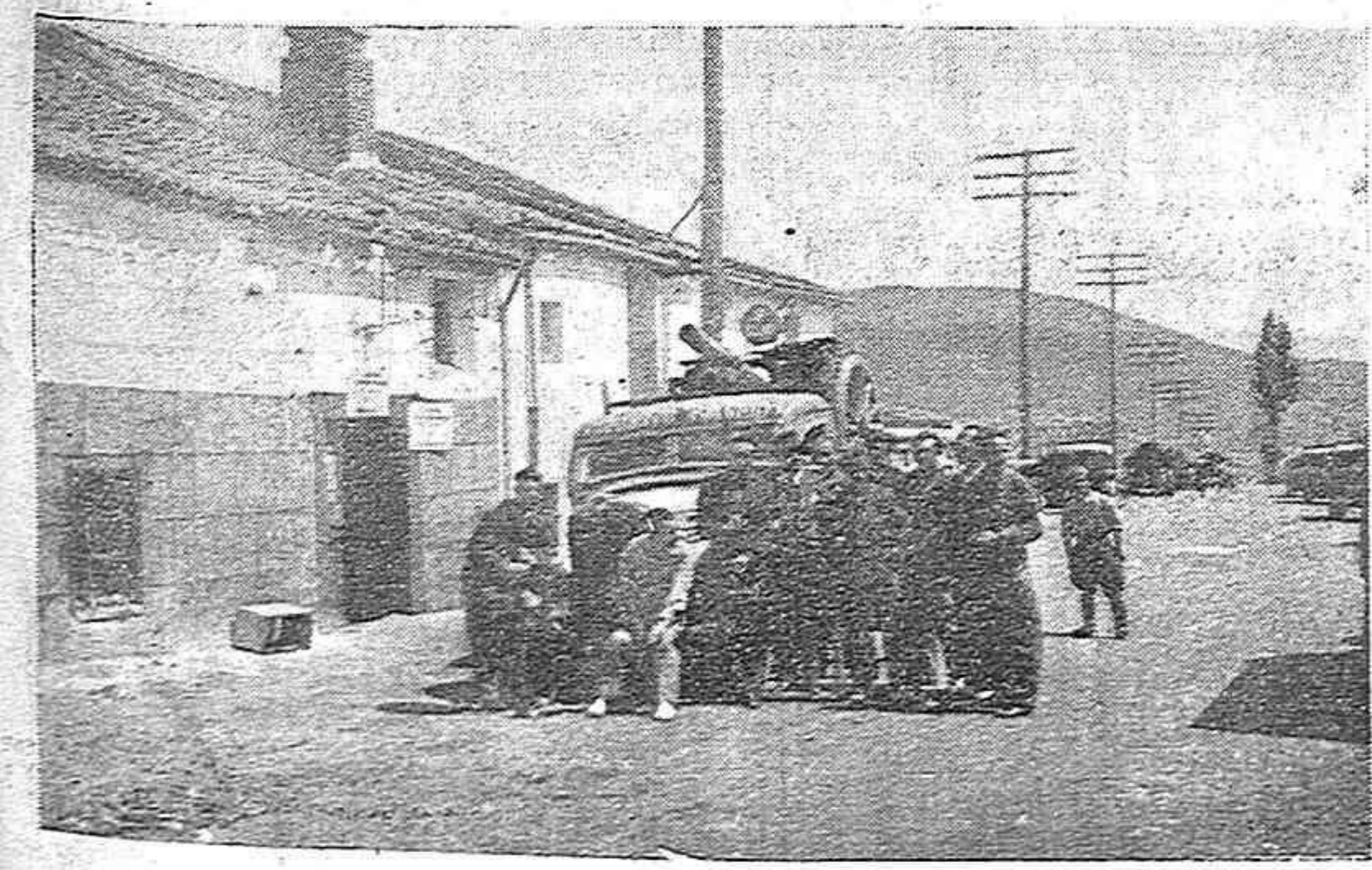
Grupo de sorianos que fué custodiando una expedición de víveres enviados a Somosierra, haciendo un alto en la marcha