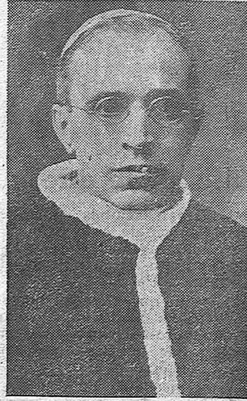
S. S. EL PAPA

que según afirman los medios diplomáticos, se interpondrá entre Alemania y Polonia, en favor de la Paz.