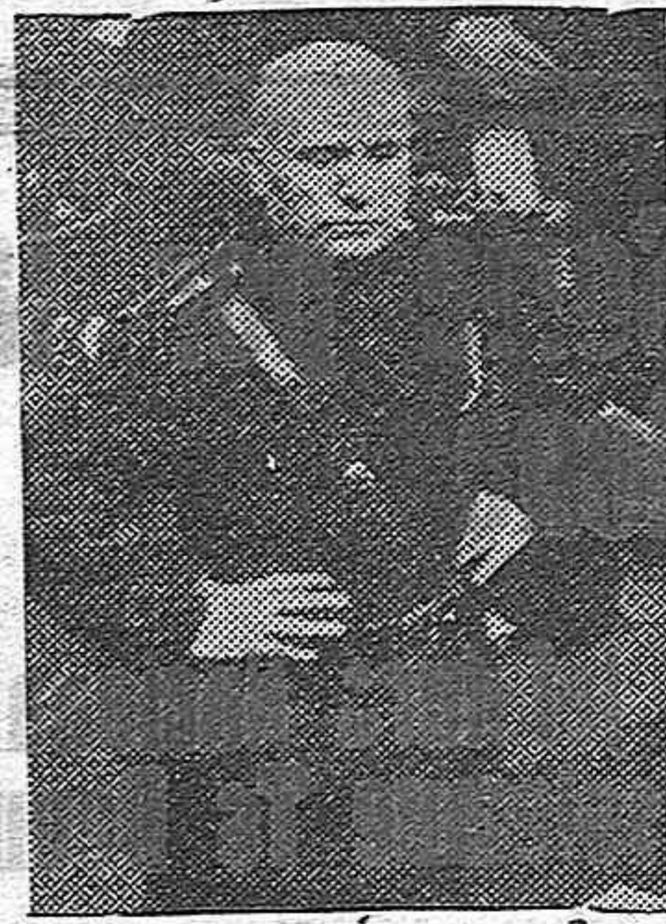
El Duce, que desde el primer momento creyó en la victoria de Franco anuncia al mundo el triunfo de las armas españolas.

Sí. Hemos de parar la pluma porque todas las noticias que nos lleguen que no sean estas antedichas, hoy resultan pasadas. ¡Está todo tan lejos!