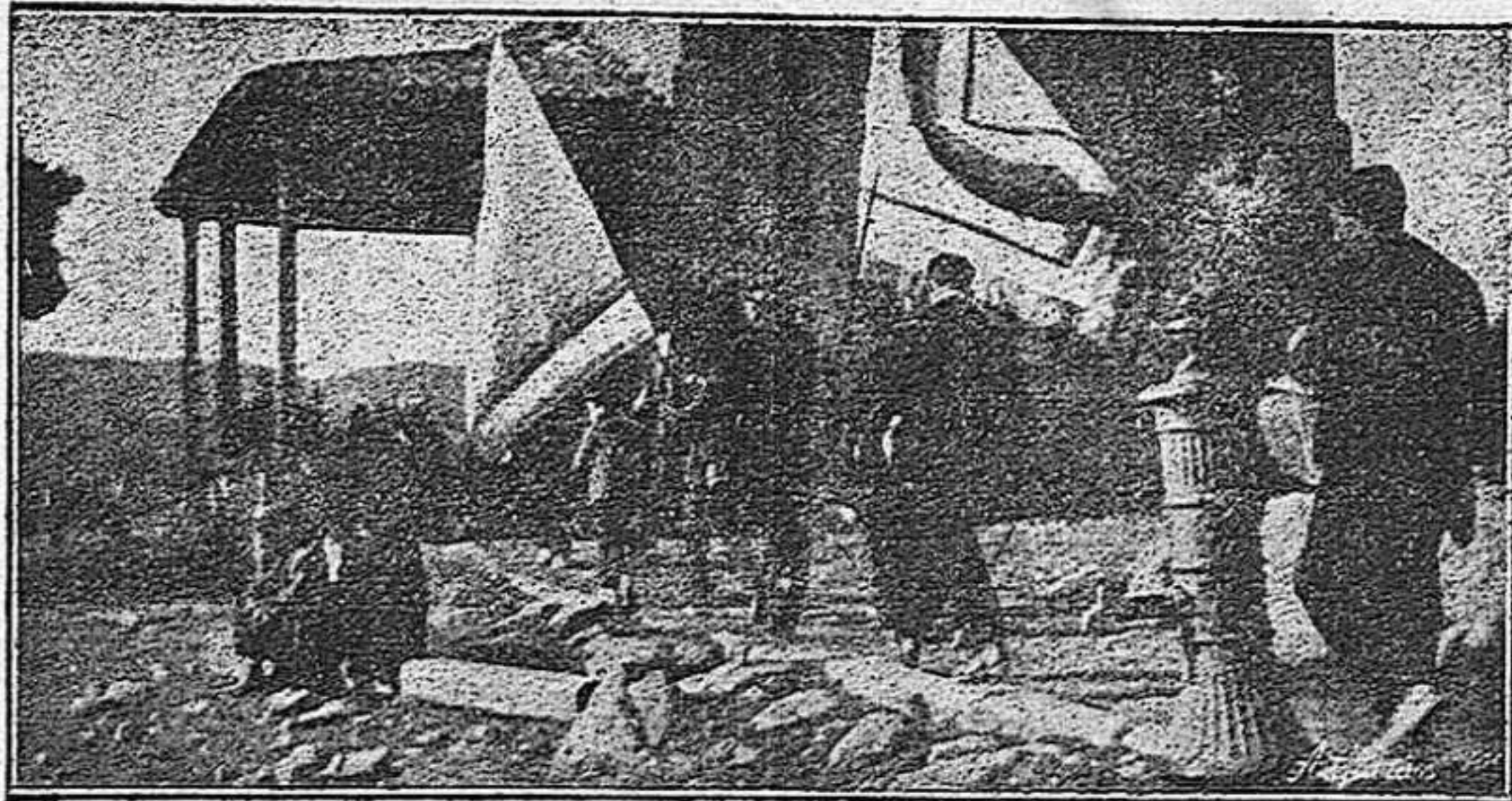
Ermida de la Soledad. Sitio donde se forma la Pinochada.