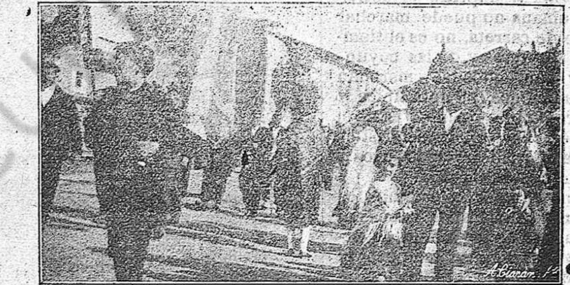
Animación de las calles al paso de la Pinochada.