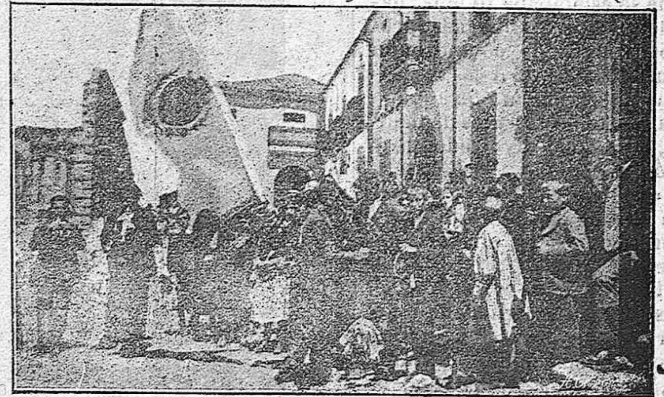
Revoloteo de banderas á la puerta de la Iglesia en la Plaza Mayor.

Creemos que los Ayuntamiento de dichos pueblos deben procurar para años sucesivos, esta atracción de forasteros, y con las empresas de automóviles establecidas, debe anunciar