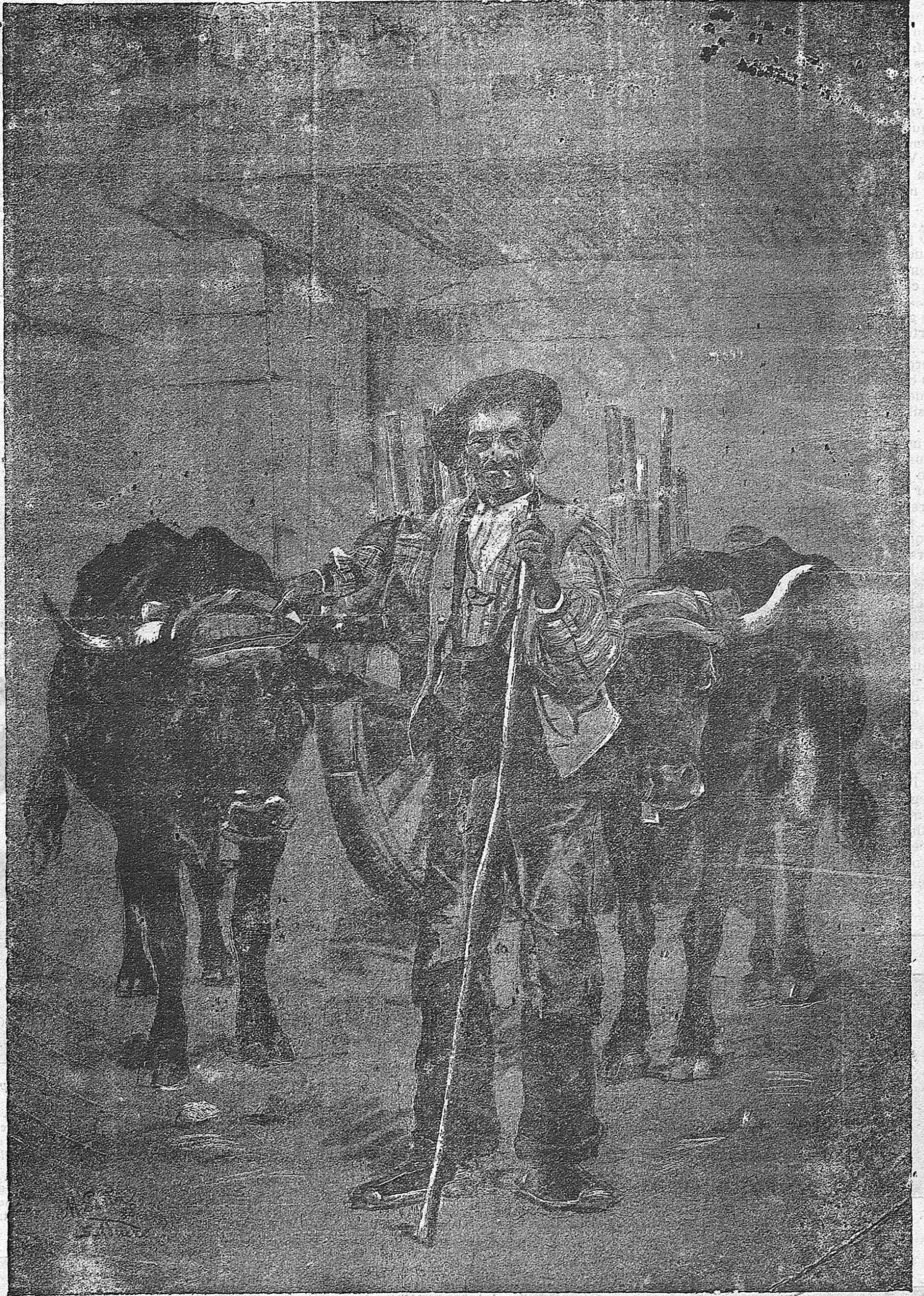
Costumbres del país, cuadro del eminente artista soriano Maximino Peña.