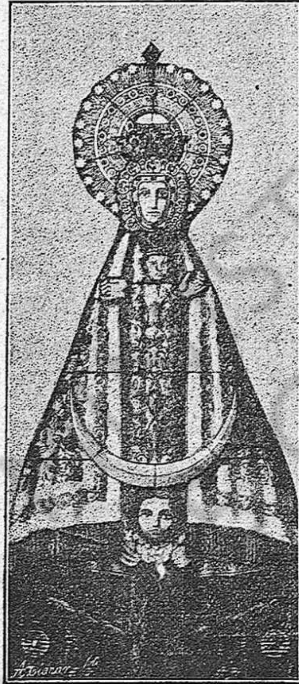
LA VIRGEN DEL PINO Patrona de Vinuesa