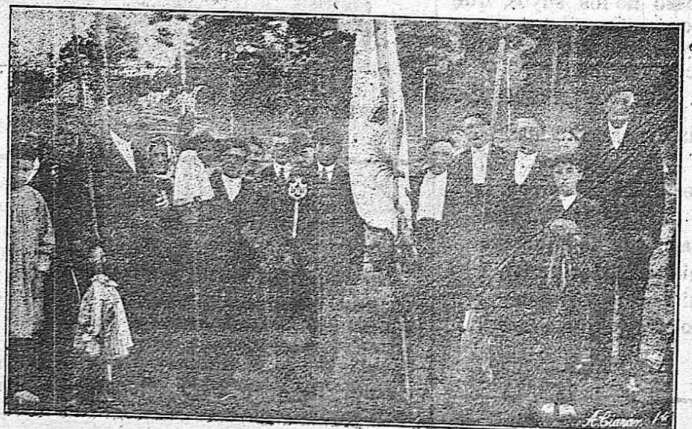
Las Cofradías de este año en la ceremonia del Campo Verde.

Y que por la falta de comunicación que hasta hoy ha habido, tan poco conocido es por la generalidad de los paisanos