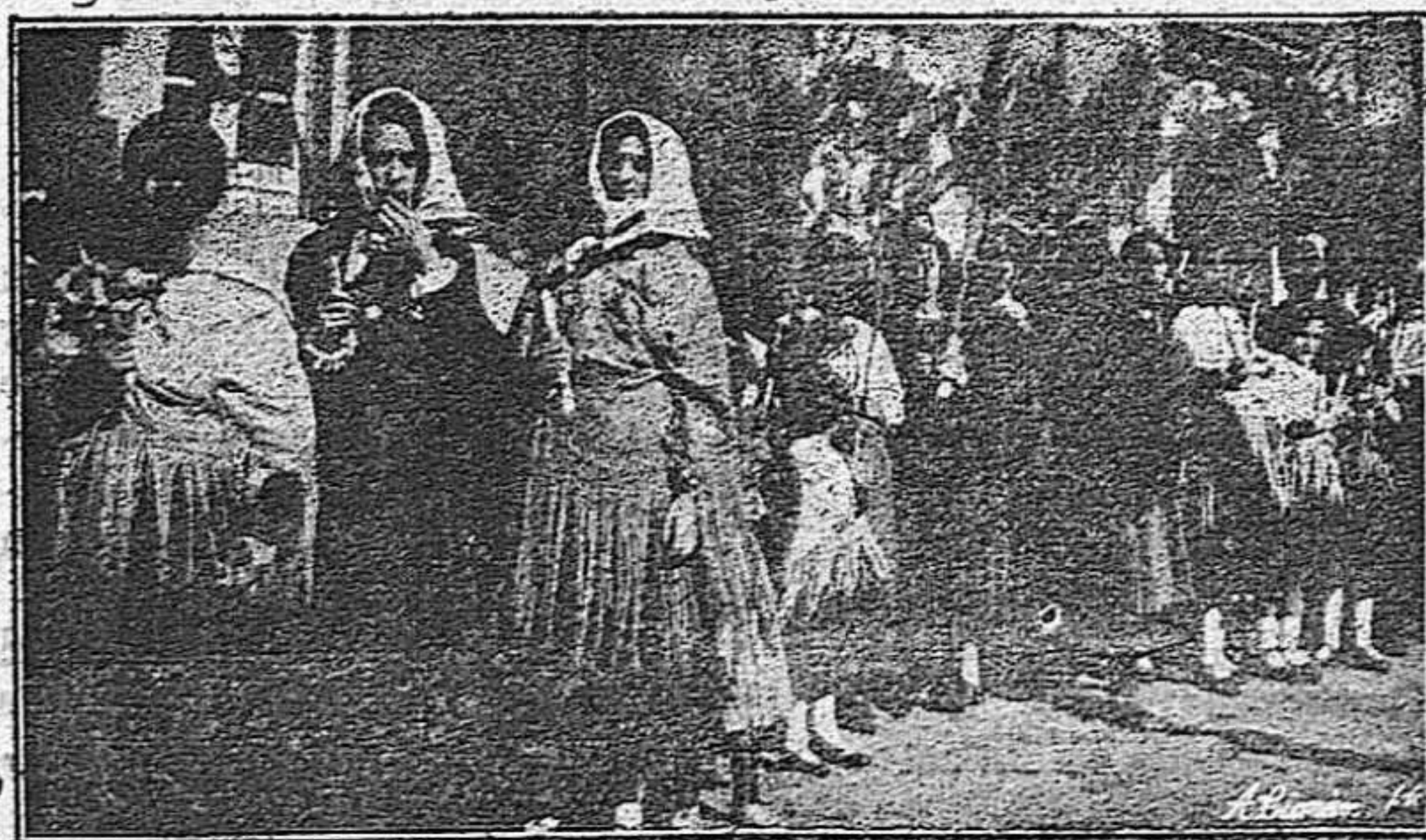
Las Pinorras de la Pinochada disponiéndose para el simulacro de la batalla