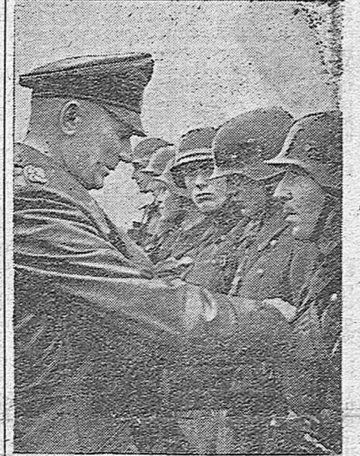
El mariscal de campo alemán, von Bock, condecorado a sus soldados de una División de caballería con la Cruz de Hierro, que les fué otorgada por el Führer.

El Cairo, 25. — El comunicado oficial británico anuncia que ha sido ocupado Bengasi. — Efe.