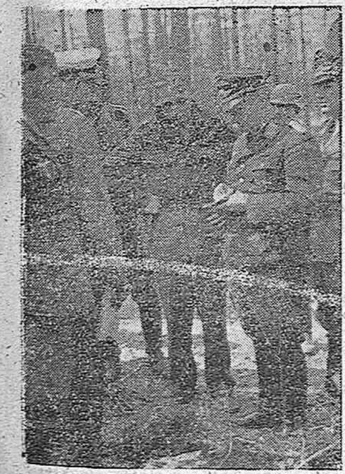
Un aviador inglés, cuyo avión fue derribado en los arrabales de Berlín, es interrogado

Berlín, 4.—En los combates aéreos sobre el Canal de la Mancha han sido derribados 21 cazas y un bombardero ingleses. El enemigo derribó un caza alemán y dos bombarderos.—Efe.