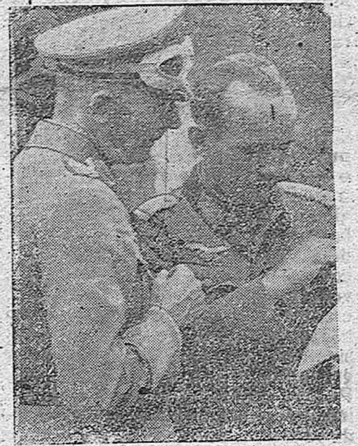
El Mariscal von Bock que manda el grupo de ejército en el sector de Smolensko, recibe los informes de sus divisiones

Londres, 4.—La agencia Reuter afirma que después de estos días de breve descanso parlamentario Churchill hablará en los Comunes, exponiendo la situación de la guerra, la conversación con Roosevelt y las relaciones con Norteamérica y la U. R. S. S. Churchill ha dicho que las relaciones y ayuda a la U. R. S. S. se hablará en sesión secreta. En los medios políticos se ha recibido con desagrado esta noticia pues se cree que todo esto debe saberse públicamente.—Efe.