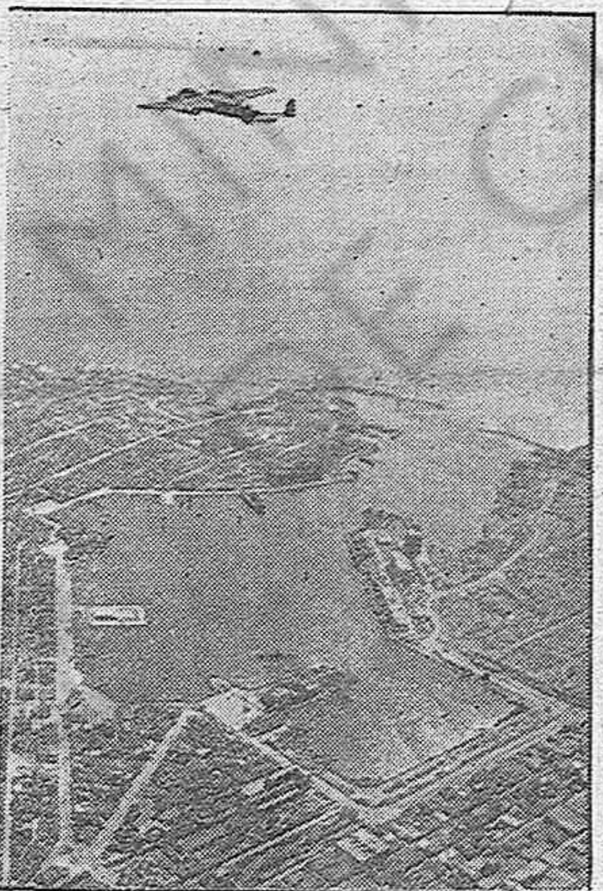
El puerto de Chalkis en el que se ven varios barcos hundidos por las bombas alemanas, que los tenían los ingleses para otra de sus «estrategias retiradas»

Comunicado alemán Berlín, 16.—El comunicado del