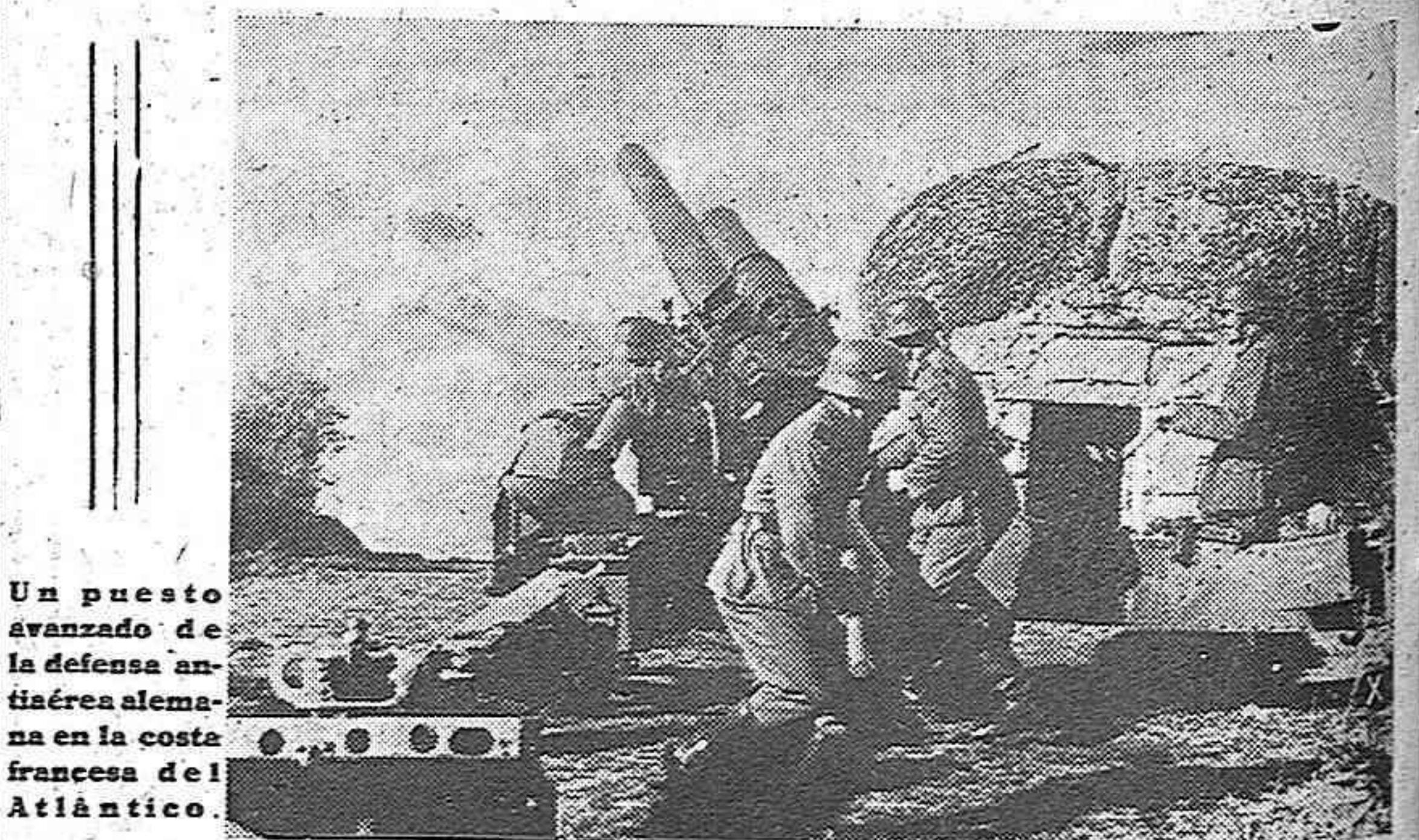
Un puesto avanzado de la defensa antiaérea alemana en la costa francesa del Atlántico.

ocasiona anualmente un considerable número de víctimas entre los niños.