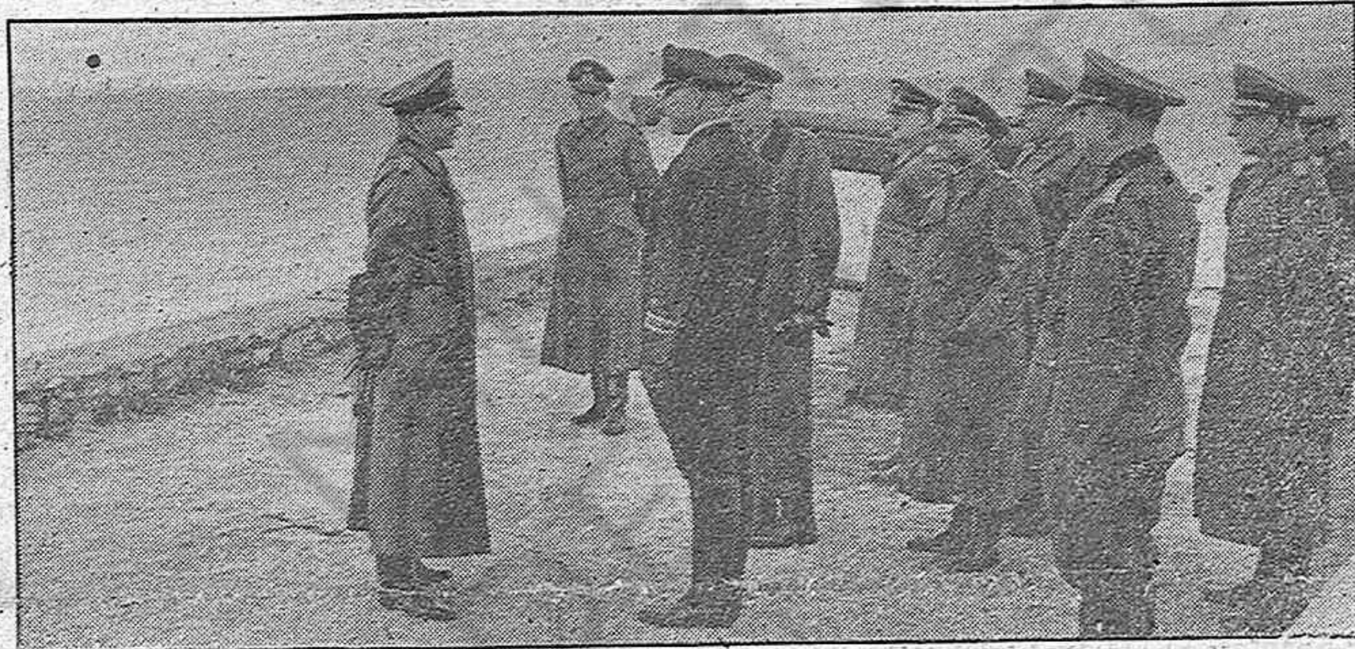
El Mariscal von Brauchitsch (izquierda) inspeccionó detenidamente la costa francesa del Atlántico cerciorándose de su perfecta defensa.

Vichy, 23.—Francia ha aceptado la proposición japonesa de mediación en el conflicto indochino tailandés.—Efe.