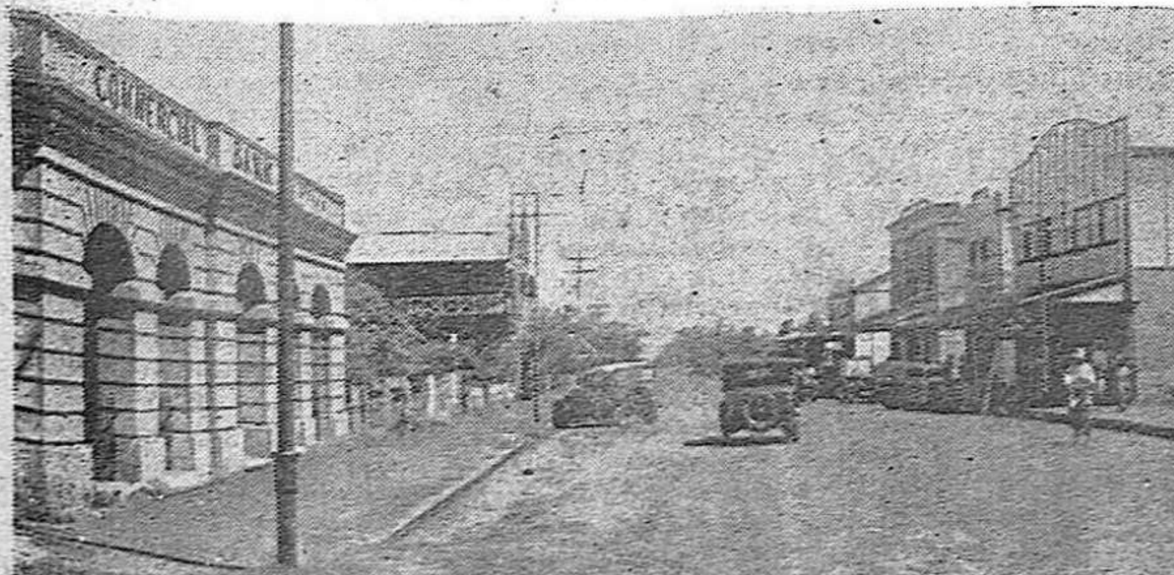
El puerto australiano de Port Darwin está siendo fuertemente bombardeado por los japoneses, y ya ha sido evacuado por la población civil ante el temor de invasión. La foto muestra una calle de la ciudad.