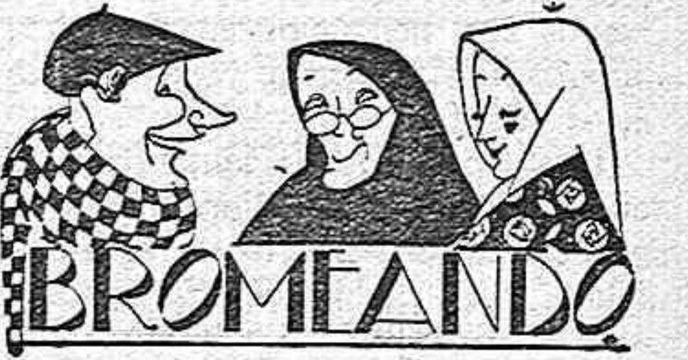
COSAS DE ANTAÑO