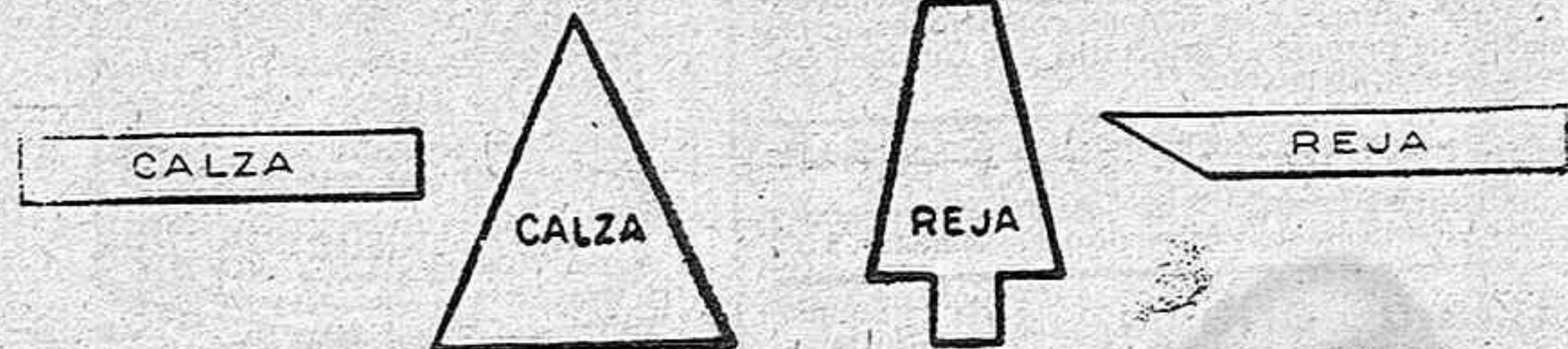
RECORTES Y PLETINAS PARA FABRICACIÓN DE HERRAJES.