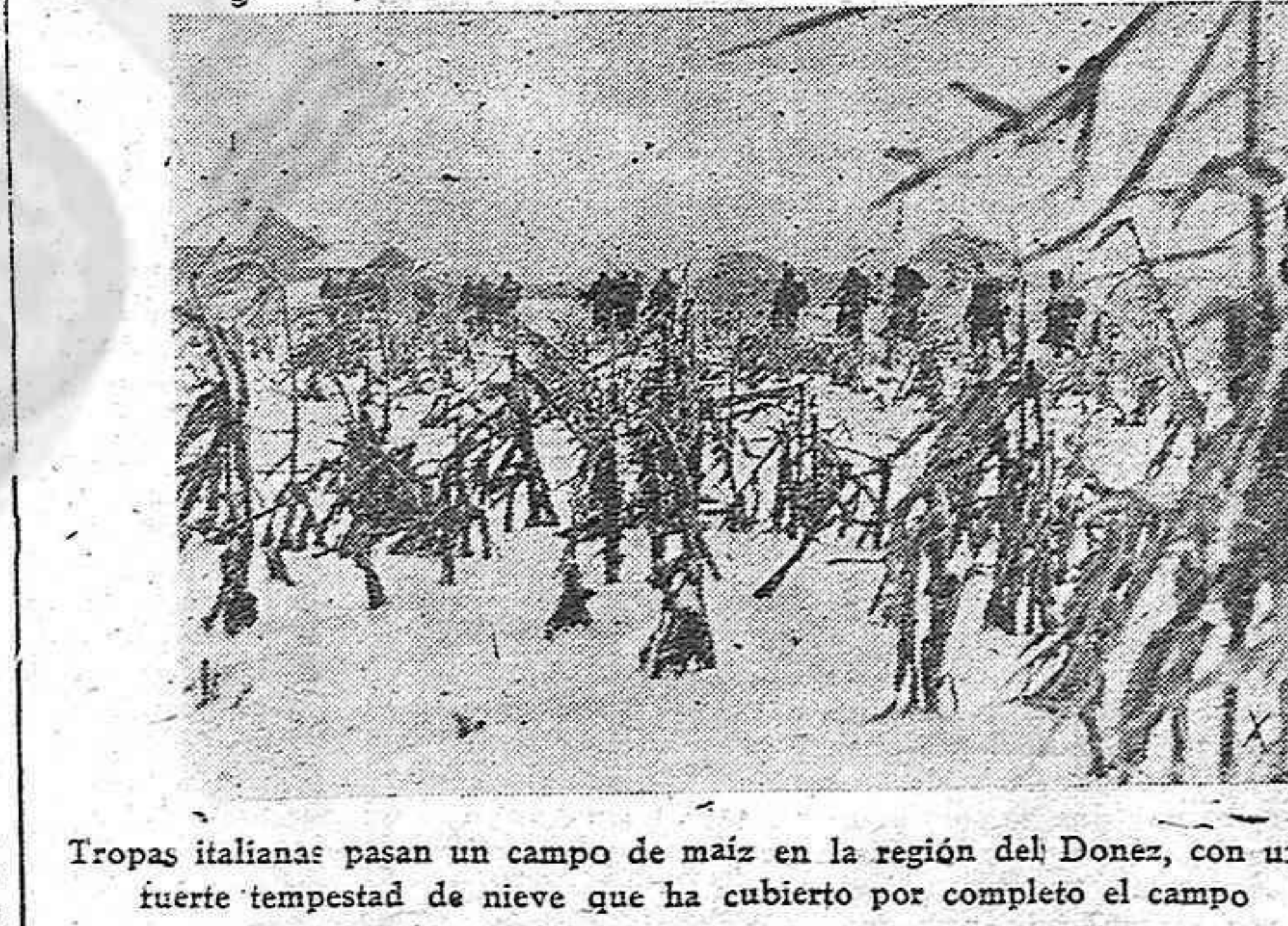
Tropas italianas pasan un campo de maíz en la región del Donet, con una fuerte tempestad de nieve que ha cubierto por completo el campo