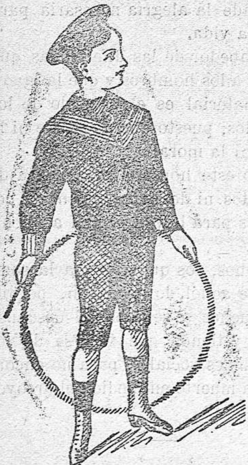
Modelos diferentes en trajecitos de paño

El mejor regalo para niños en Reyes, son las capitas impermeables