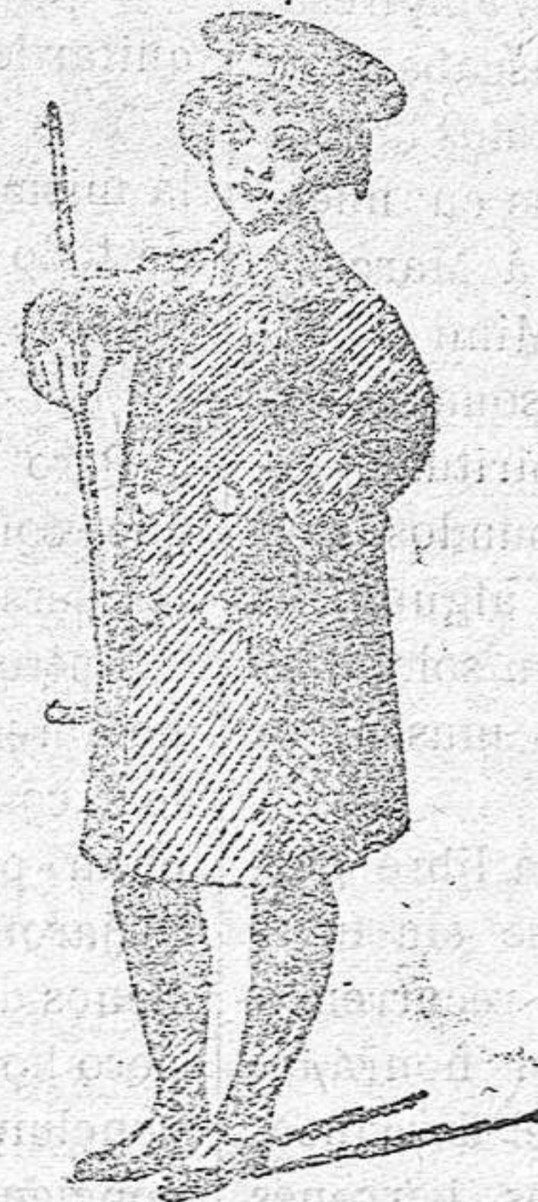
Gabancitos para niños de 10, 12, 18 y 30 pesetas