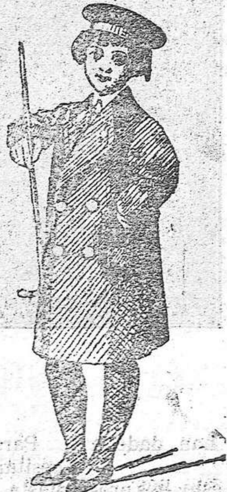
Gabancitos para niños de 10, 12, 18 y 30 pesetas