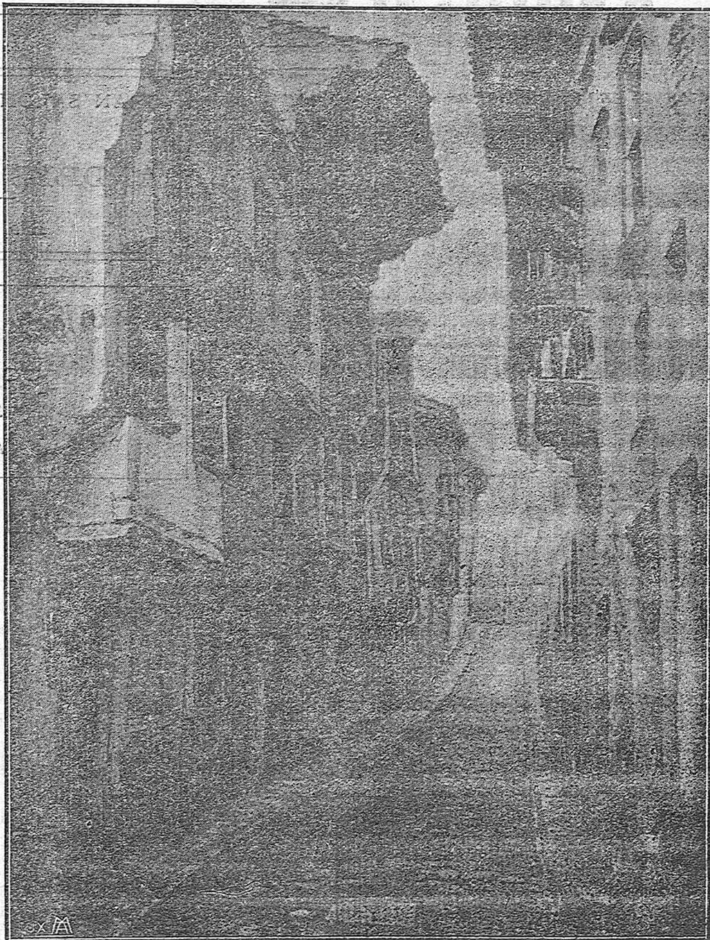
Pueblo del Norte.

Que nosotros ya cuidaremos con todo lo que nos sea posible, de seguir siendo de su agrado.