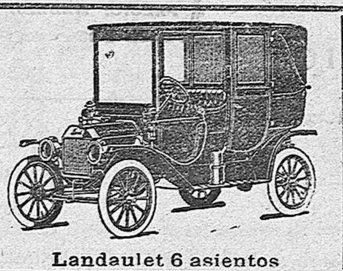
Landulet 6 asientos