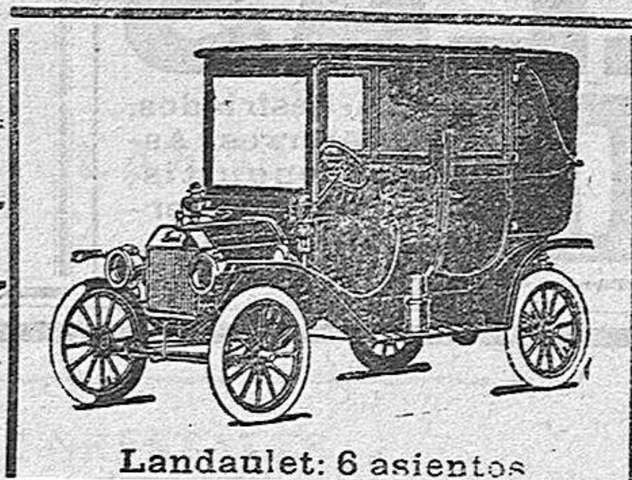
Landulet: 6 asientos