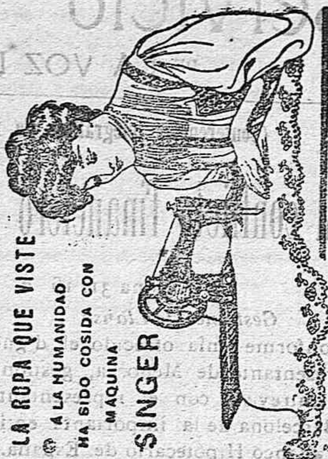
LA ROPA QUE VISTE A LA HUMANIDAD HA SIDO COSIDA CON MAQUINA SINGER

A los suscriptores se les hace un 25 por 100 de rebaja.